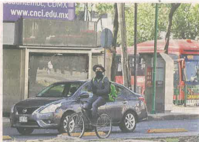
Los servicios de comida a domicilio también hacen uso de la bicicleta durante la pandemia.

Además, recordó que para seguir fomentando los viajes en este vehículo, se anunció ya la licitación de biciestacionamiento con 200 espacios en Escuadrón 201 y, después, se pretende recuperar el espacio aledaño para hacer una biciescuela o alguna otra actividad para