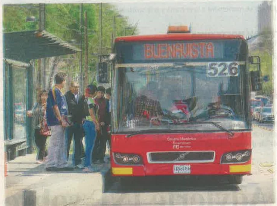
Actualmente corre de San Lázaro a Buenavista

Como resultado, se añade, quedará prohibido, a partir del inicio de operaciones del corredor, el tránsito en los carriles confinados, salvo en tramos autorizados; los movimientos de vuelta izquierda o de-