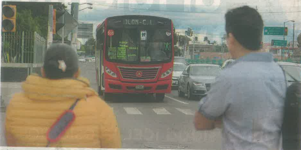
Gabriel O'Shea Cuevas refrendó el llamado a utilizar el cubrebocas en las unidades del servicio público, pues es latente el contagio

Al llegar a su lugar de destino, es indispensable lavarse las manos con agua y jabón, durante 20 segundos, o utilizar gel antibacterial antes de retirar el cubrebocas.