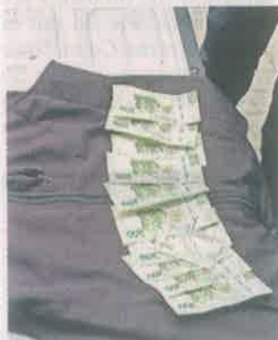
El falso contralor portaba chaleco con logotipos de la CDMX y efectivo.

/// Fingía velar por la transparencia para reducir las obras en la Alcaldía y el correcto funcionamiento de negocios; interactuaba con facilidad con policías y personal”.