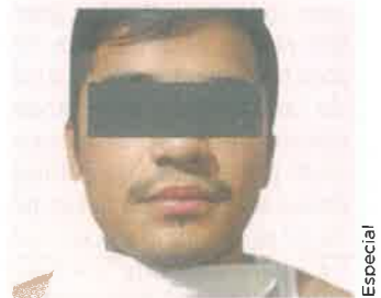
■ "El Junior" fue detenido el 21 de mayo.

Los procesados permanecen en el Reclusorio Sur, ya que desde la semana pasada se les dictó la prisión preventiva oficiosa.