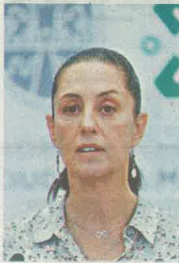
Se evitarán contagios

Indicó que el próximo lunes arranca el Plan Gradual hacia la Nueva Normalidad, por lo que el inicio de las actividades económicas, laborales, culturales, educativas y deportivas estará sujeto a la semaforización presentada por la Federación y la cual se publicará en la Gaceta Oficial capitalina.