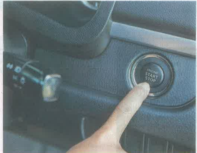
PONLO EN MARCHA. Una vez que el motor encendió, no aceleres de inmediato, debemos dejar que las piezas internas se lubriquen.

deteriorarse y agrietarse con el paso del tiempo, la humedad y los cambios de temperatura y romperse.