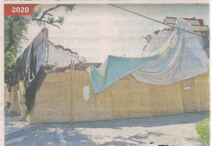
Una de las esquinas ya presenta avances de demolición.