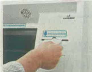
Medida ante pandemia