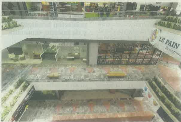
Los centros comerciales deberán abrir sólo 30% de su capacidad total para evitar aglomeraciones y mantener la sana distancia.

De acuerdo con la propuesta de protocolo para el reinicio seguro de actividades en el transporte público, a la cual EL UNIVERSAL tuvo acceso, también se recomienda limpiar y sanitizar diario, sobre todo tubos, pasamanos, timbres, ma-