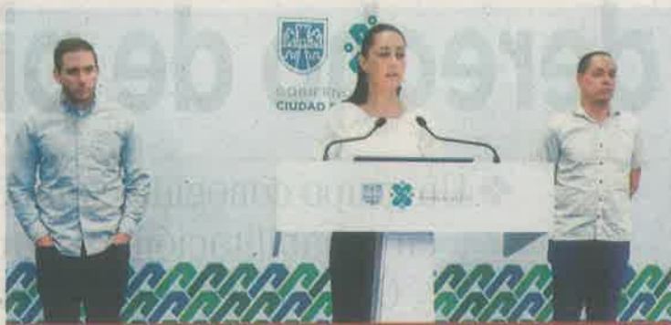
De seguir con esta tendencia, los hospitalizados estarían disminuyendo en los próximos días, informó la mandataria.

“La CDMX sigue en semáforo rojo, aun cuando no hay incremento en el número de camas ocupadas en hospitales de la CDMX, todavía no logramos que inicie la reducción y por lo tanto se siguen manteniendo las mismas medidas que son no salir a la calle, quedarse en casa y usar cubrebocas de manera obligatoria, lavarse las manos con agua y jabón, estornudo de etiqueta y