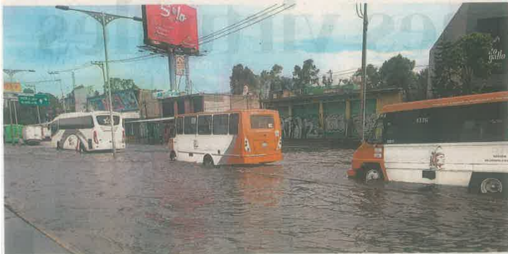
Con base al atlas de afectaciones por lluvias del año pasado, durante la pasada temporada se redujeron 39% las afectaciones a la población y a sus bienes

El año pasado se registraron encharcamientos en 135 sitios; alistan al Grupo Tláloc para respaldar a la población