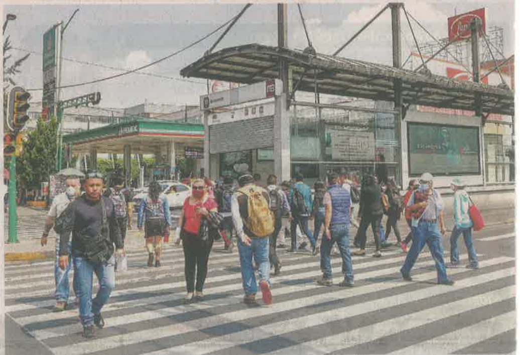
Las estaciones del transporte público, son los puntos que presentan mayor concentración.

“Seguimos en semáforo rojo, en toda la semana que