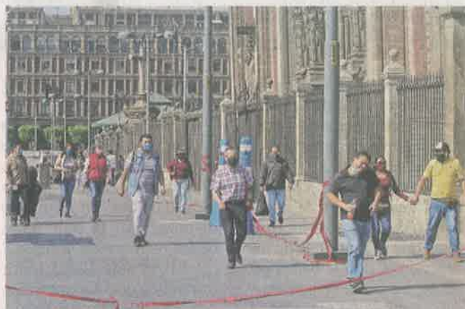
Las autoridades exhortaron a mantenerse en casa aún con el término de la Jornada Nacional de Sana Distancia.

“Seguimos en semáforo rojo, en toda la semana que viene, esto implica que siguen las medidas de sana distancia, si no tenemos necesidad de salir, nos quedemos en casa”.