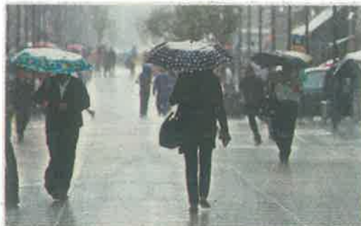
Se alistan ante contingencias