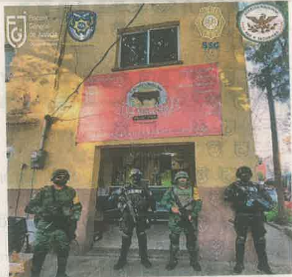
Elementos de seguridad resguardan uno de los inmuebles intervenidos

En la colonia Morelos, fueron intervenidos cuatro domicilios ubicados en las calles Jesús Carranza, Granada y Constancia, donde fueron detenidos tres hombres y dos mujeres, y aseguradas cerca de 83 dosis y un paquete de