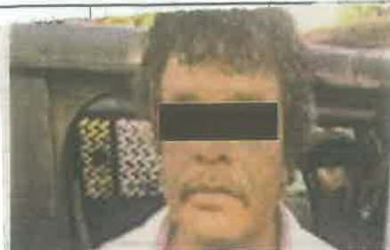
Los individuos fueron detenidos por elementos de la SSC, en posesión de dinero en efectivo, tres teléfonos celulares y una réplica de arma de fuego

Por lo anterior uniformados les realizaron una revisión a ambos tripulantes, tras la cual les encontraron dinero en efectivo, tres teléfonos celulares y una réplica de arma de fuego.