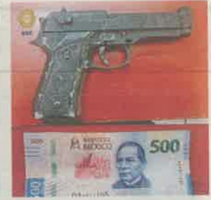
Los dos sujetos fueron detenidos en posesión de una réplica de arma de fuego

a unas calles quienes al observar a los uniformados corrieron para tratar de huir y, luego de una persecución por algunas calles de la colonia, fueron asegurados.