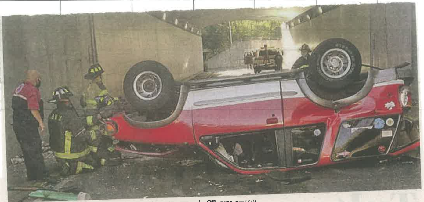
Testigos del accidente llamaron al número de emergencia 911