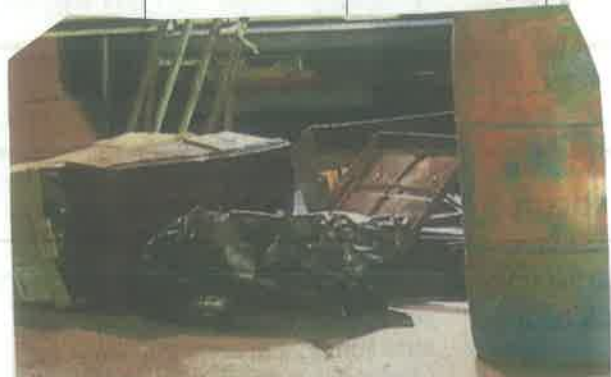
Héctor Efraín y Alan Yair fueron desmembrados.

DEALERS fueron captura- dos en distintos operativos, en los que incau- taron drogas.