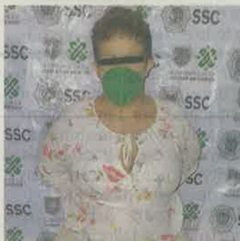
La Chofis fue detenida por segunda ocasión este viernes

ma de fuego en una bolsa, dijo a los agentes que cuando llegaron temió que la mataran porque no sabía que eran policías.