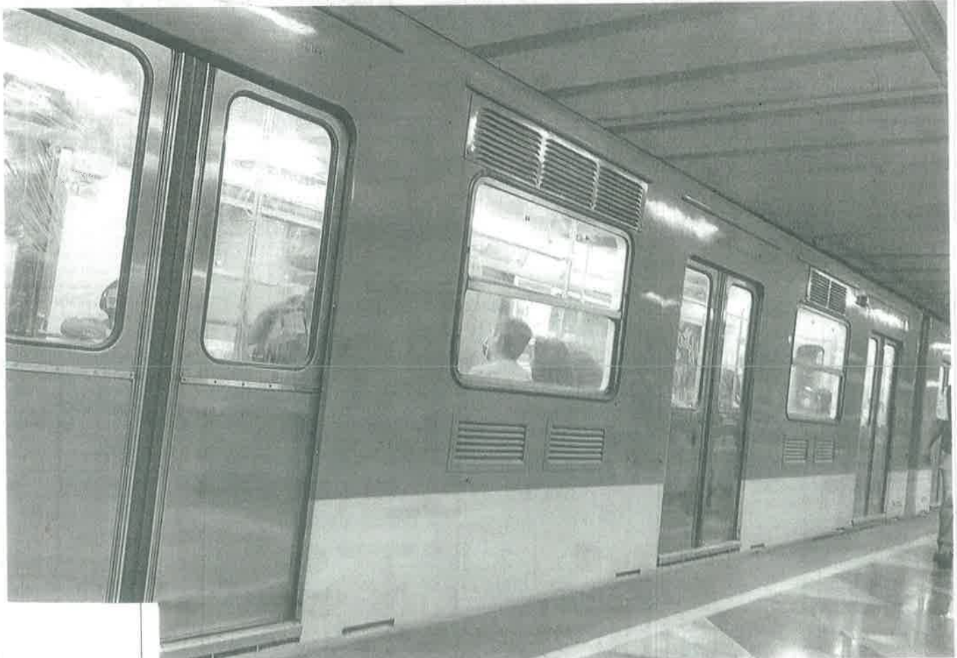
Después de 50 años de servicio habrá una renovación integral.

HABRÁ ESCRUTINIO INTERNACIONAL EN LA MODERNIZACIÓN DE LA LÍNEA 1 DEL METRO, ADVIERTE EL GOBIERNO DE CDMX Pág. 3