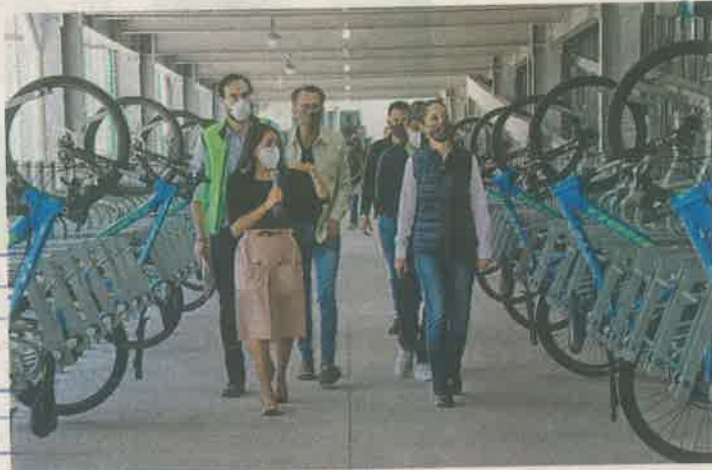
El biciestacionamiento de Tláhuac operará los 365 días del año, con capacidad para resguardar 400 bicicletas de manera gratuita

Los ejes de la política de movilidad del gobierno de la Ciudad de México son el transporte público y la movilidad peatonal segura, declaró la jefa de gobierno, Claudia Sheinbaum al poner en marcha el biciestacionamiento Tláhuac con capacidad para 400 bicicletas.