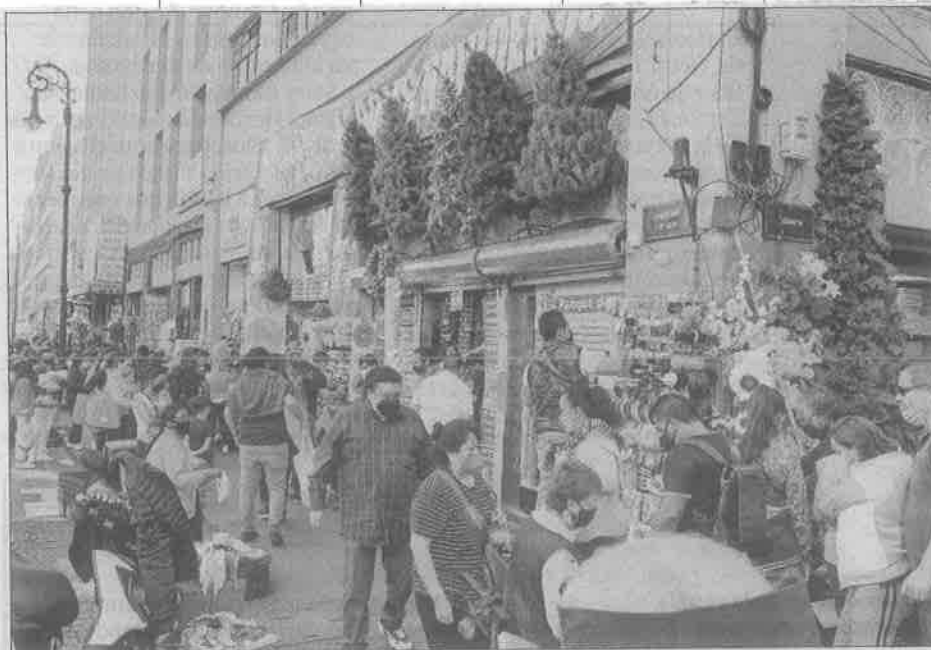
▲ Ofertas de cualquier tipo se ven en los negocios de Venustiano Carranza, que de plano se extendieron hacia las aceras, donde compiten con los ambulantes. Cada año