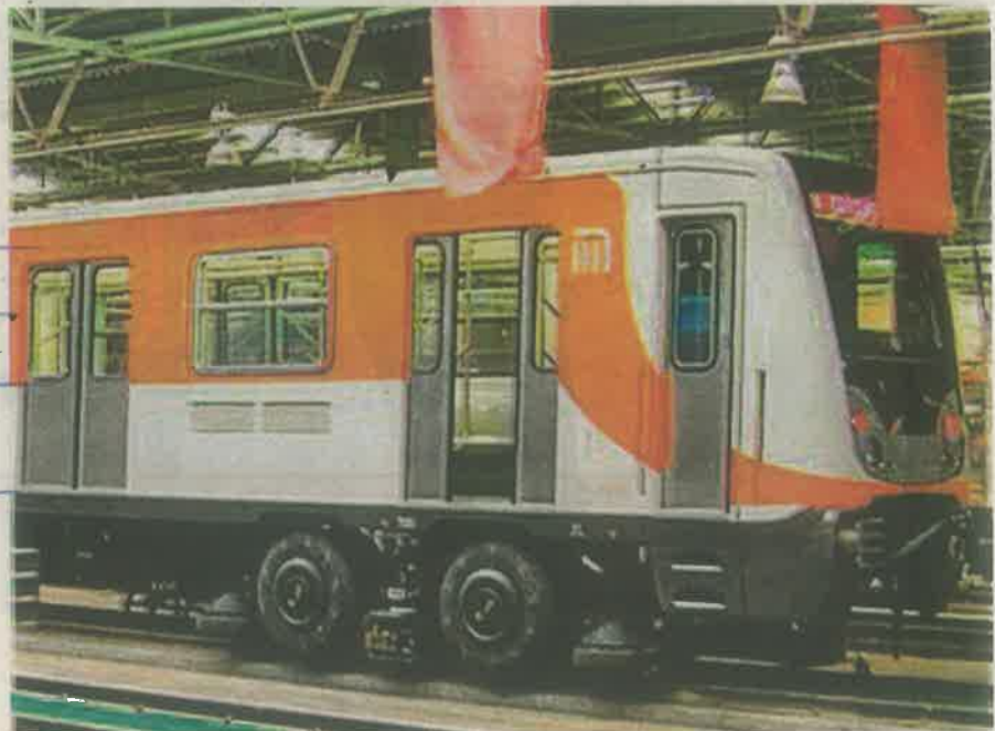
Sobre el rumor del aumento al precio del boleto, no lo habrá, pues cuentan con un fideicomiso

"Se trata de una renovación integral y una modernización completa de la Línea 1 del Metro que es urgente que se haga, porque ya tiene 50 años", indicó la jefa de gobierno al precisar que este proyecto inclu-