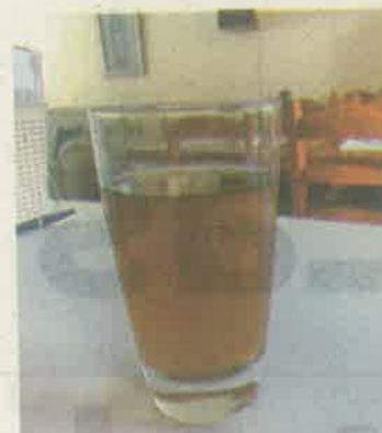
En hogares del Estado de México, las personas estaban molestas porque el agua salió turbia.