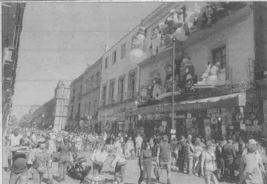
este mes es de los más esperados por los comerciantes, aunque con el coronavirus esperaban una baja en sus ventas.