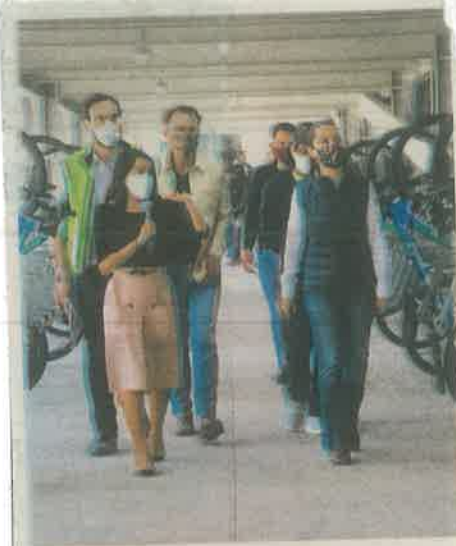
Sheinbaum inauguró un biciestacionamiento en Tláhuac