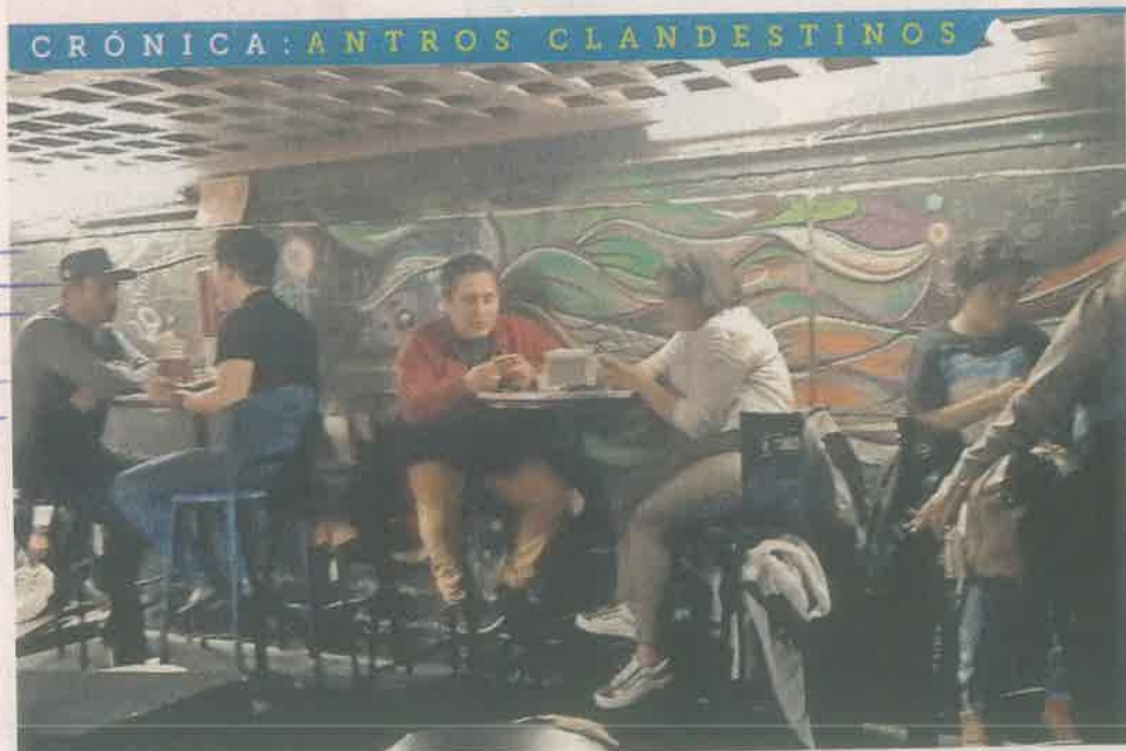
LA FIESTA SIGUE. A una cuadras de la sede del Gobierno capitalino operan bares que simulon convertirse en restaurantes o en locales cerrados para dar servicio sin medidas sanitarias.

Como parte del Programa Reabre, los bares podían operar al reconvertirse en restaurantes, pero unos establecimientos continúan laborando de la misma for-