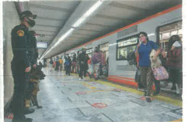
● METRO. El proyecto considera una fase de rehabilitación de cuatro años en la Línea 1.