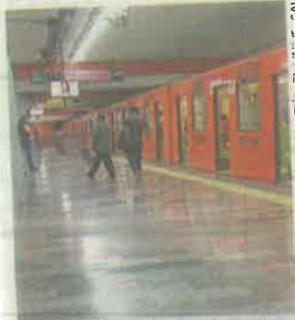
La firma china CRRC Zhuzhou entregará trenes para el STC.