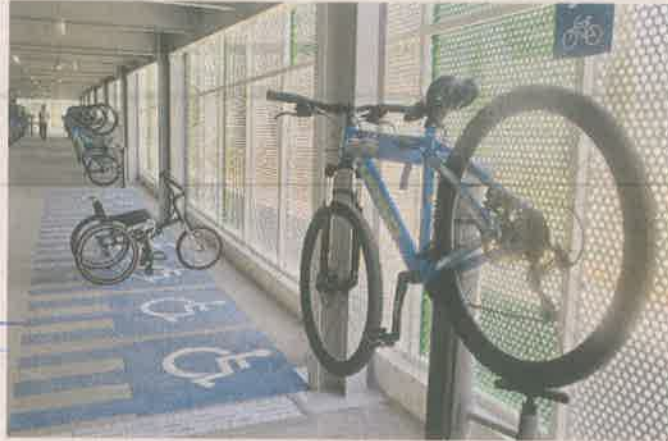
La estructura cuenta con espacio para almacenar hasta 400 bicicletas y tiene videocámaras.

En el modelo financiero se consideran varios tipos de patrocinio, incluido el es-