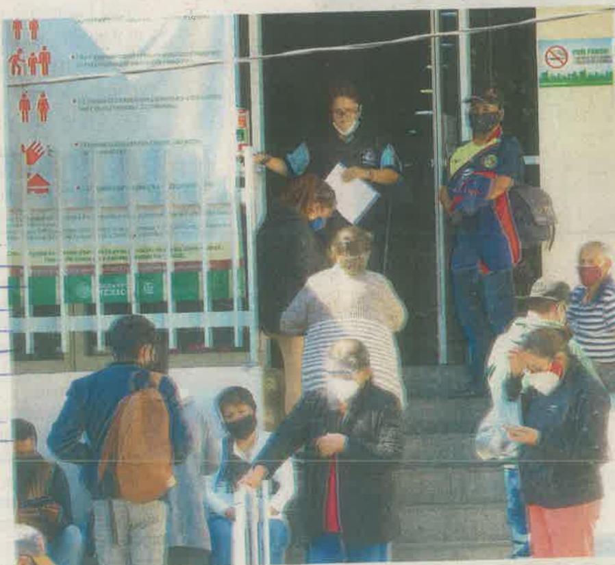
Familiares de personas hospitalizadas se congregan en las puertas de las clínicas para conocer el estado de su paciente

Los hospitales ya empiezan a saturarse. Tan es así que de los 65 nosocomios que están habilitados en el sector público para atender casos de coronavirus, 37 ya están a tope. Incluso han colocado letreros que advierten: hospital sin disponibilidad, como es el caso del Instituto Nacio-