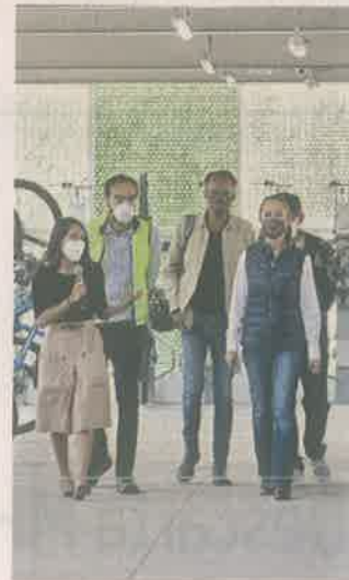
Al inaugurarlo, funcionarios recorrieron el lugar.

Desde los límites con Ixtapaluca y la Autopista a Tláhuac, vecinos llegan a la terminal Tláhuac, de la Línea 12, por 25 kilómetros de ciclovías, cuya construcción generó molestias, pero ahora son utilizadas, mencionó el Alcalde Raymundo Martínez.