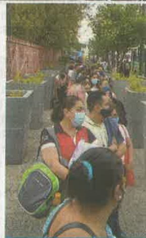
El trayecto de la estación Zapata a Olivos se recorrió en más de dos horas, incluyendo la fila para abordar el autobús.

La congestión intensa en puntos como el puente de Eje 8 Sur y Eje 3 Oriente, y Avenida Tláhuac en los cruces con Avenida Taxqueña y Periférico Oriente provocaron que el traslado se tornara lento y los usuarios tuvieran que esperar en el autobús sin sana distancia.