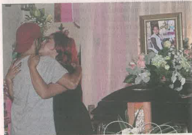
Ayer, su cuerpo fue velado por sus tres hijos y familiares.