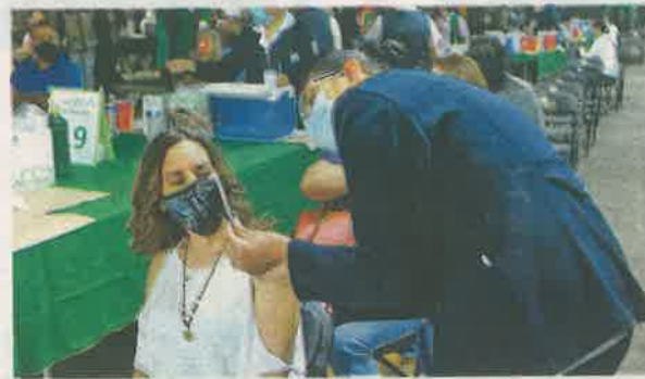
Al finalizar la Fase II se espera haber cumplido con 24% de cobertura de vacunación de 1.26 millones de personas de entre 50 a 59 años

Y se instalarán dos unidades vacunadoras: una en la Biblioteca Vasconcelos que está ubicada en el Eje 1 Norte, en la colonia Buenavista, y la segunda sede en la Escuela Primaria Benito Juárez, en la calle de Jalapa 272, colonia Roma Sur.