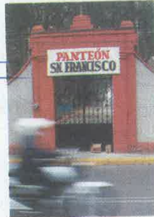
El panteón de San Francisco permaneció ayer cerrado, pese a que tenían permitido abrir.

instalaciones, los visitantes no podrán reproducir música, deberán respetar los protocolos, portar en todo momento cubrebocas y mantener la sana distancia.