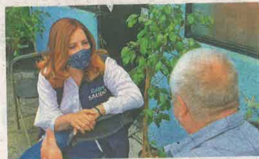
Diputada Gabriela Salido , presidenta de la Comisión de Uso y Aprovechamiento del Espacio Público del Poder Legislativo capitalino

Afinan mesa de trabajo con el titular de Obras y Servicios para tratar proyectos, como parque y calzada flotante