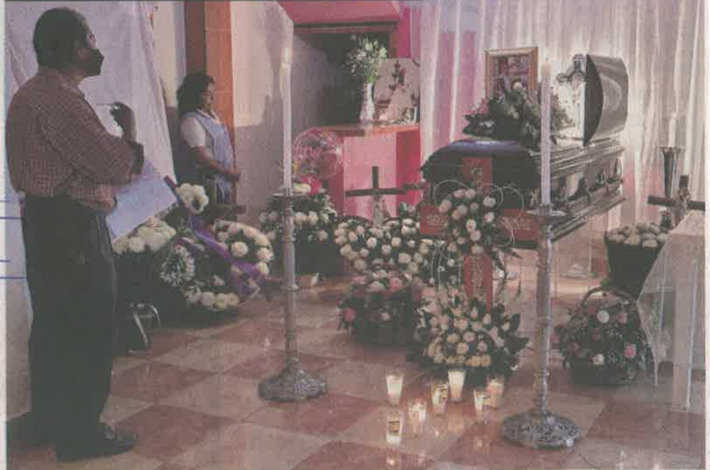
■ Para despedir a Araceli, sobre su ataúd fue colocada una fotografía y varios arreglos florales.