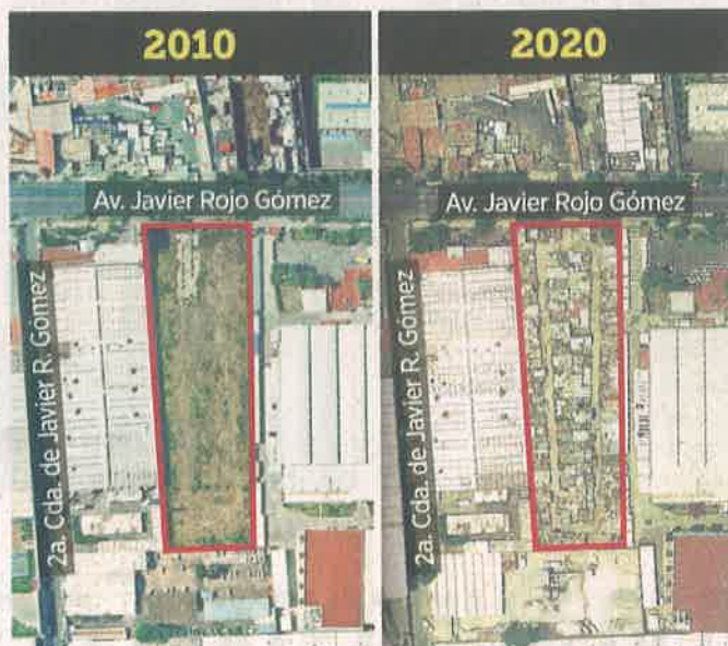
■ En una década, los invasores han construido sus viviendas.