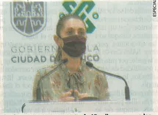
Se da un apoyo emergente de 10 mil pesos para las personas hospitalizadas, dijo Claudia Sheinbaum.