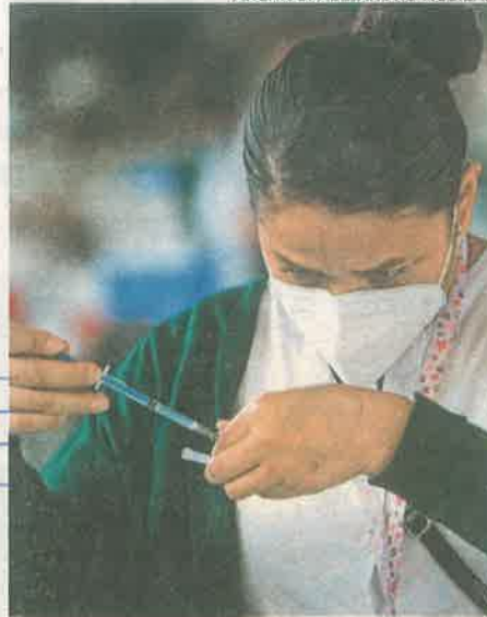
Toca el turno a mayores de 50

Ya tienen el esquema completo de vacunación 79% de los adultos mayores, sólo faltan tres alcaldías en segunda dosis