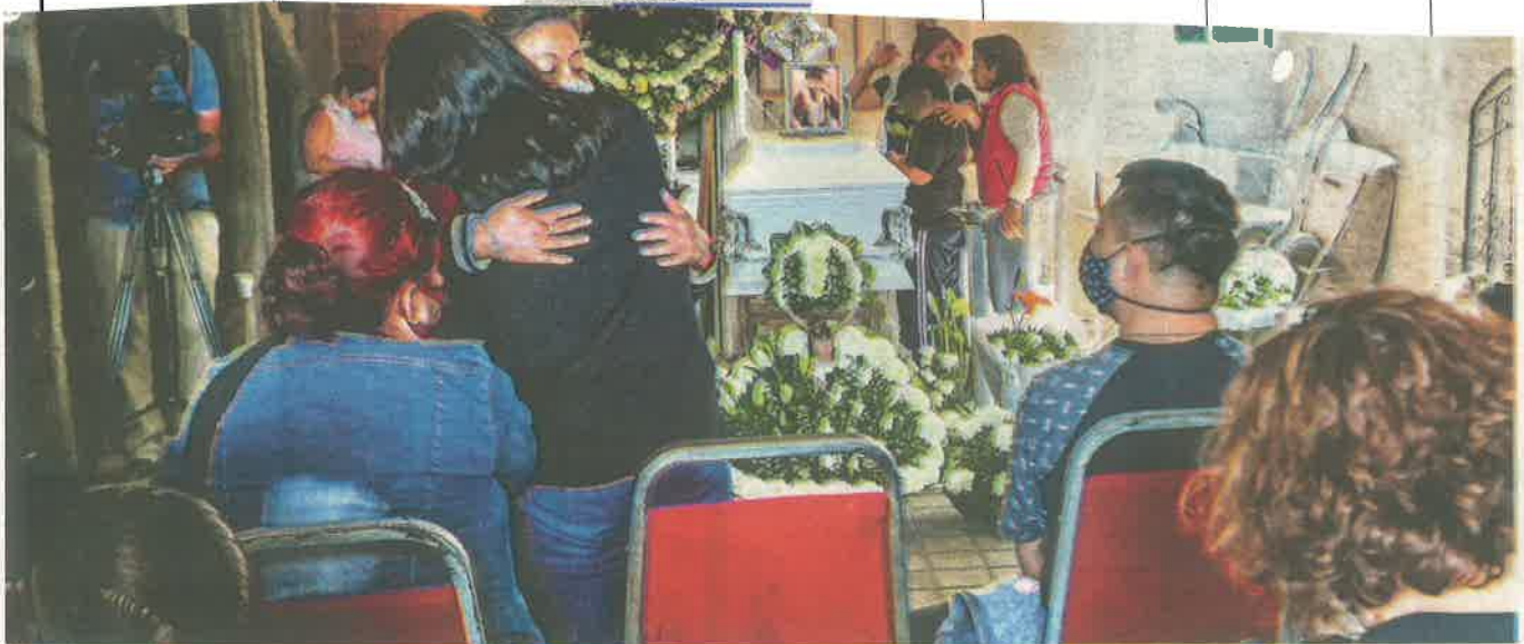
Todos los deudos serán atendidos