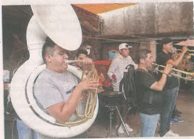
Una banda de la Colonia tocó canciones como Amor Eterno.