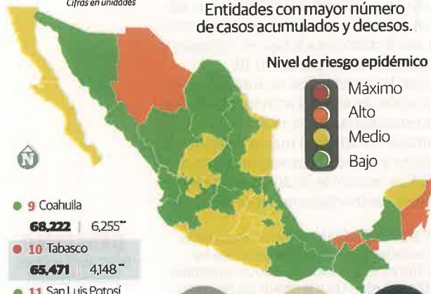
Cifras en unidades

*Casos positivos con fecha de inicio de síntomas en los últimos 14 días