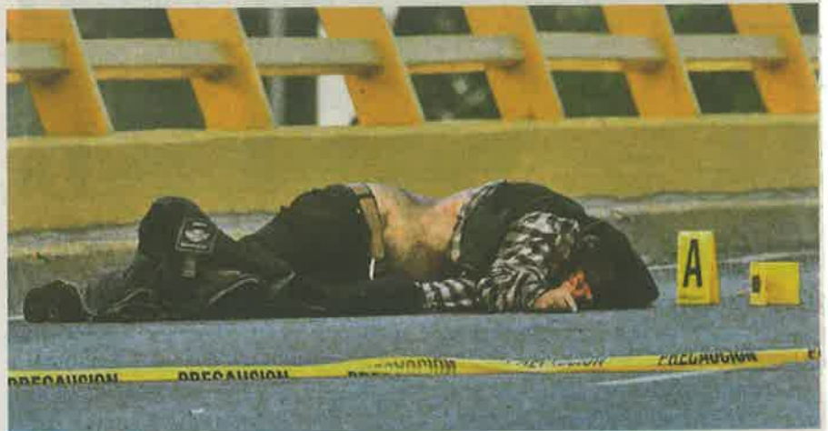
Se desconocen las causas por las cuales el conductor perdió el control de su moto, hecho que le costó la vida debido a los brutales golpes que se dio contra el asfalto

A pesar de contar con equipo de seguridad como casco y chamarra, el varón sufrió múltiples traumatismos y quedó in-