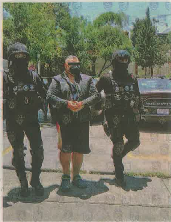
El arrestado fue ingresado al Reclusorio Preventivo Varonil Sur, donde quedó a disposición de un juez

Al continuar con las indagatorias, los detectives ubicaron y aprehendieron al individuo en calles de la colonia