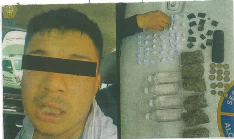
Un poco de todo cargaba este sujeto en una bolsa, cuando fue sorprendido por la policía; trafa hierba, coca, crystal y unos frascos con una sustancia que será analizada en laboratorio

Por lo anterior, el joven de 21 años, fue puesto a disposición del agente del Ministerio Público correspondiente, junto con la aparente droga asegurada, quien determinará su situación jurídica, no sin antes comunicarle sus derechos de ley.