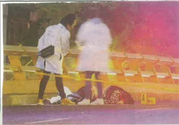
Después de cinco horas fue levantado el cuerpo del occiso por las autoridades ministeriales