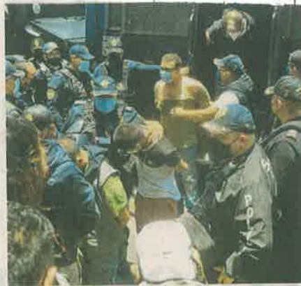
A los detenidos se les confiscó droga y armas de fuego

Cuando llegaron a la calle Tepozanes, tres sujetos comenzaron a agredir a los oficiales y realizaron detonaciones de arma de fuego, por lo que los uniformados