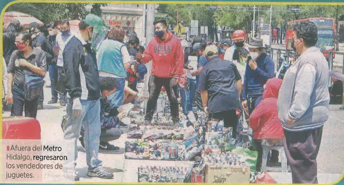
■ Afuera del Metro Hidalgo, regresaron los vendedores de juguetes.

PRETENDEN CLAUSURAR NEGOCIOS EN EL CH QUE VIOLAN LAS MEDIDAS DE HIGIENE