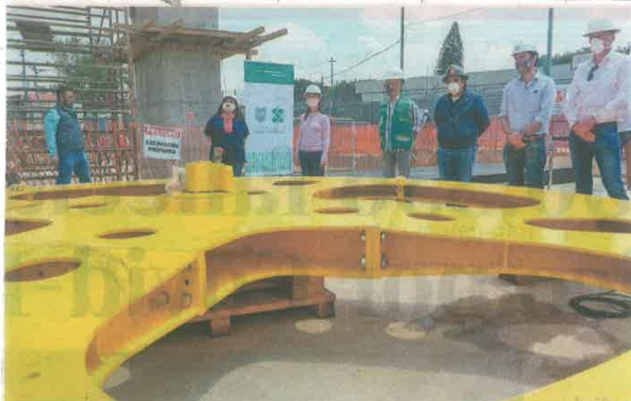
La jefa de gobierno, Claudia Sheinbaum, estuvo en el Cetram Constitución de 1917 para supervisar las obras; ahí, la alcaldesa Clara Brugada dijo que la Línea 2 del Cablebús beneficiará a sectores más vulnerables

Las cabinas, con capacidad de diez personas, llegarán cada 10 segundos a las estaciones; el Cablebús está pensado para integrar varios medios de transporte, como el masivo y semimasivo, para que la población de Iztapalapa reduzca en un 50% el tiempo de traslados