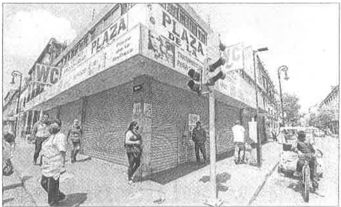
▲ La gente no dejó de ir al Centro, a pesar del aviso de cierre. Aunque algunos negocios sí abrieron, comerciantes establecidos e Informales usaron el método del gato y el