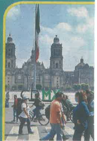
■ Alrededor del Zócalo se incrementó el flujo de peatones el sábado.