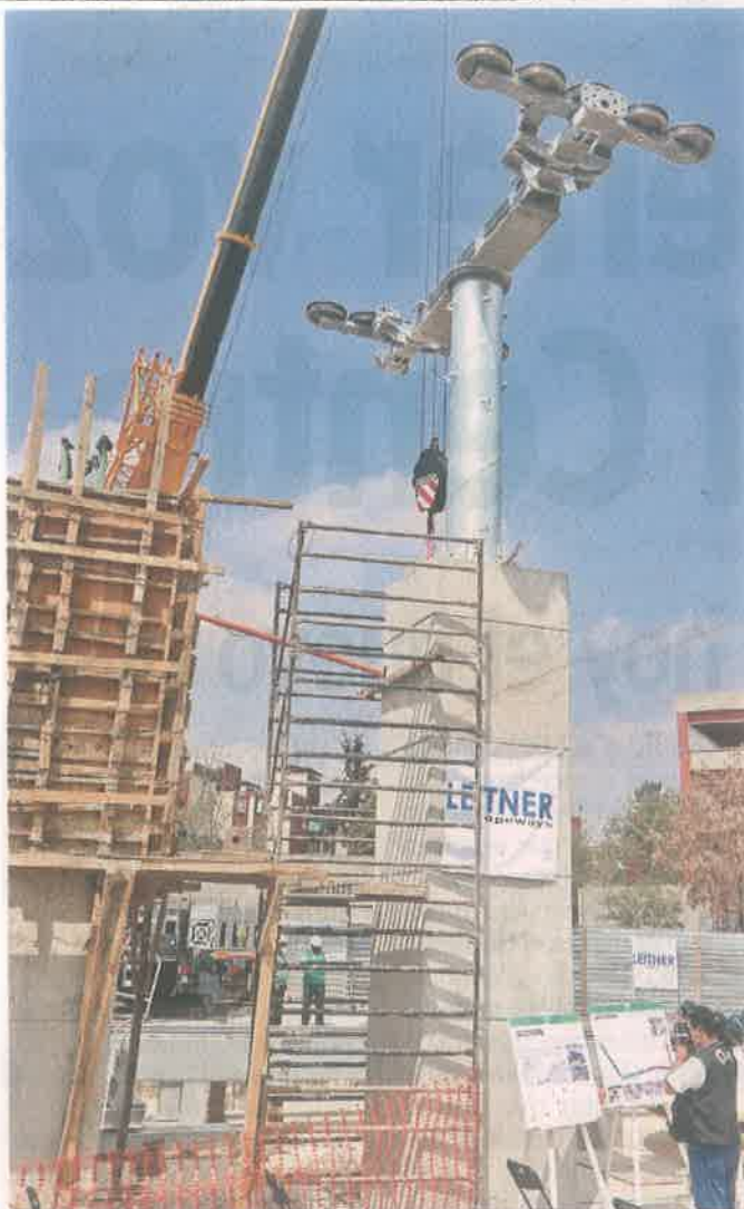
EN LO ALTO. La construcción de la segunda línea del Cablebús ya va tomando forma en la Sierra de Santa Catarina.