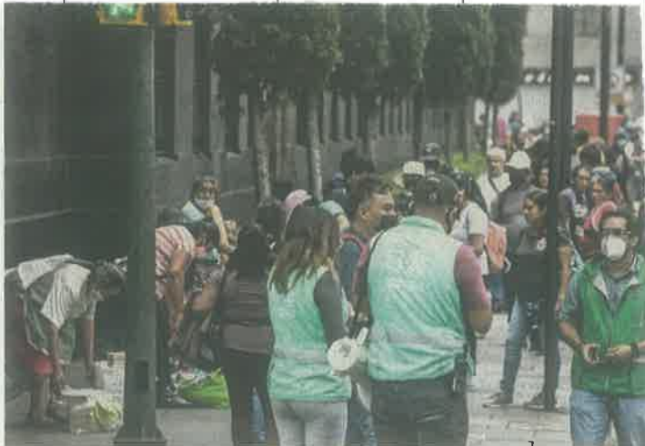
Personal del Gobierno local realizó perifoneo en las calles del Centro Histórico para que los paseantes respetaran la sana distancia.

“Nosotros vivimos al día, agarran la onda”, comentó uno de los vigilantes de los vendedores cuando les tomaban fotografías, al tiempo que los policías se acercaron para retirarlos.