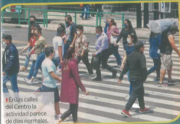
■ En las calles del Centro la actividad parece de días normales.