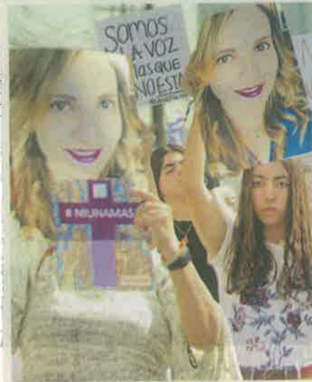
Familiares y amigos exigieron justicia para Abril