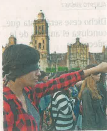
Las feministas pertenecientes a diferentes colectivos lograron agruparse en una sola célula para apostarse en la Plaza de la Constitución

En el intento por mantener la impecable coreografía de las chilenas, las manifestantes se apoyaban unas a otras para