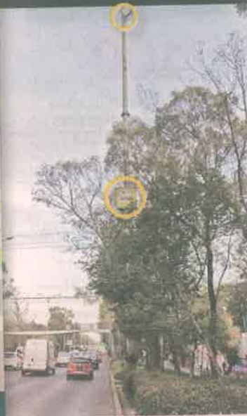
Especial / Staff