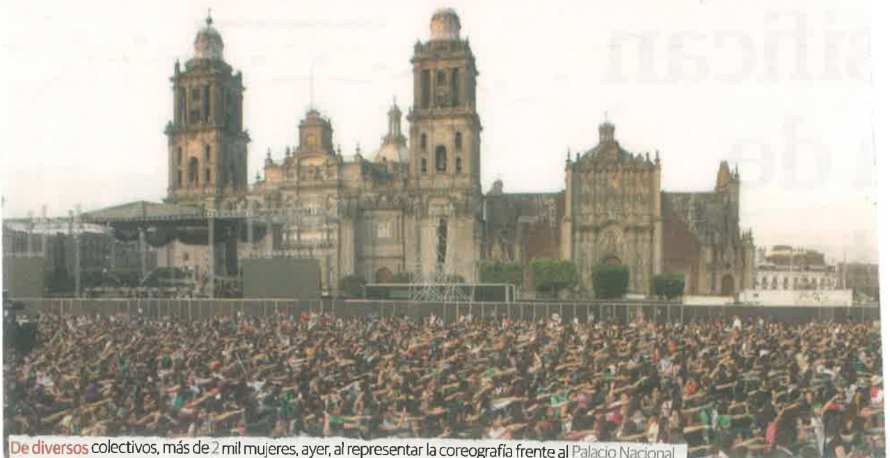
De diversos colectivos, más de 2 mil mujeres, ayer, al representar la coreografía frente al Palacio Nacional.

Cientos de mexicanas acuden al llamado y lanzaron consignas contra funcionarios e incluso contra la Corte.