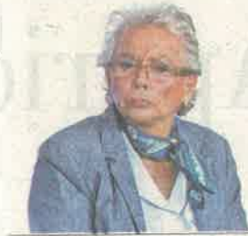
Olga Sánchez Cordero