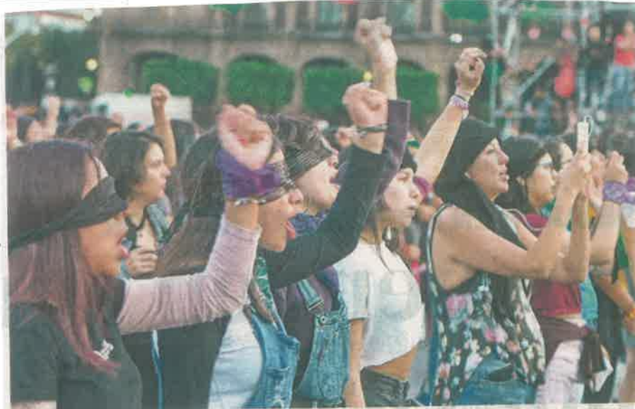
El performance "Un Violador en tu Camino", expresión de repudio contra la violencia de género, inspirado en La Tesis, de Chile

res encendidos, lanzaban destellos también de manera sincronizada.