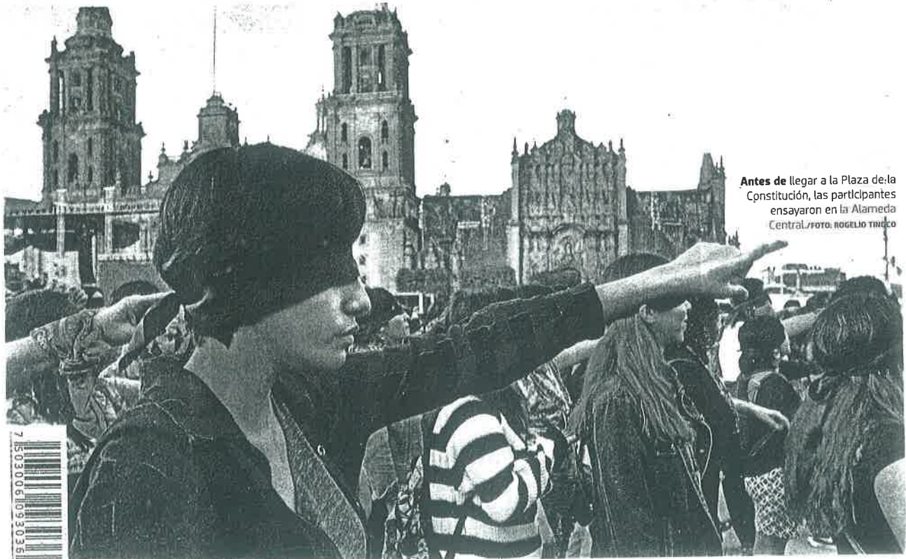
Antes de llegar a la Plaza de la Constitución, las participantes ensayaron en la Alameda Central.

REPLICAN FEMINISTAS EN EL ZÓCALO EL PERFORMANCE DE CHILE, EN REPUDIO A LA VIOLENCIA DE GÉNERO Pag. 4