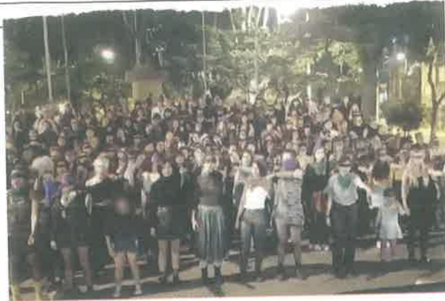
En Bogotá, activistas realizaron su propia versión.