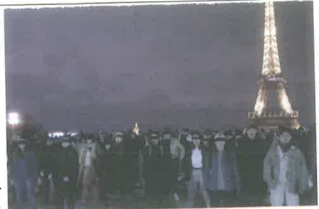
En París, feministas gritaron: "De Chile, para alzar nuestra voz".

Se suman mexicanas a grito contra la violencia