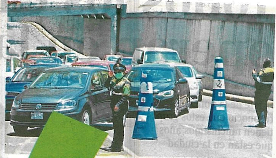
Policías ayudan en el ingreso al Viaducto y en algún bloqueo que se presente

“Si se incrementó la afluencia vehicular... pero no como lo esperábamos”