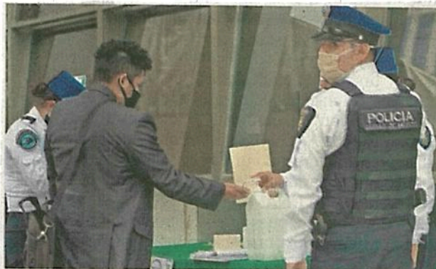
Tras cerrar por la pandemia, el Tribunal Superior de Justicia de la CDMX dejó de atender más de 64 mil juicios.

Se prevé que para el primer lunes del siguiente mes, el TSJCDMX empiece a laborar, pero sólo a 30% de su capacidad total. ●