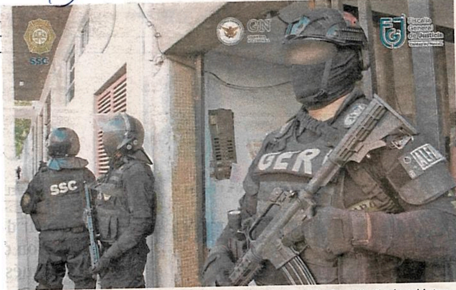
Agentes de la policía preventiva, de investigación y de la Guardia Nacional intervinieron en los operativos