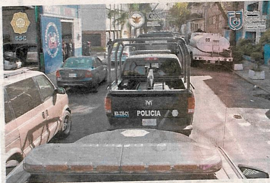
Uniformados se desplegaron en distintos puntos de la alcaldía Benito Juárez y ejecutaron cinco ordenes de cateo

Por lo anterior, personal de la Fiscalía General de Justicia (FGJ) de la Ciudad de México colocó sellos y aseguró los domicilios para continuar con las indagatorias e integrar las carpetas de investigación correspondientes.