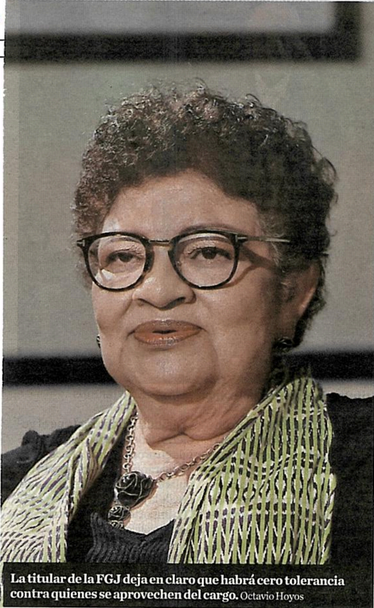
La titular de la FGJ deja en claro que habrá cero tolerancia contra quienes se aprovechen del cargo. Octavio Hoyos

presentar la denuncia "si al rato lo vas a perdonar", por ejemplo, con las mujeres.