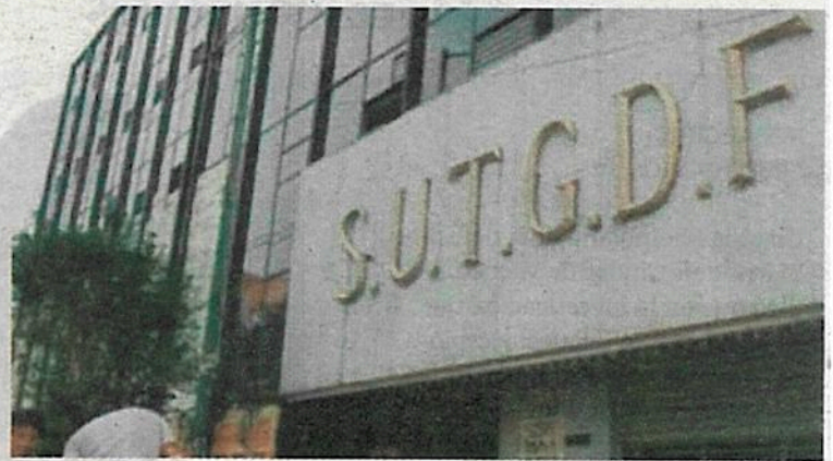
Hicieron malos manejos de los recursos

● Trabajadores de limpia de las diferentes alcaldías, fueron citados para bloquear las principales avenidas de Xochimilco, argumentando la falta de pago