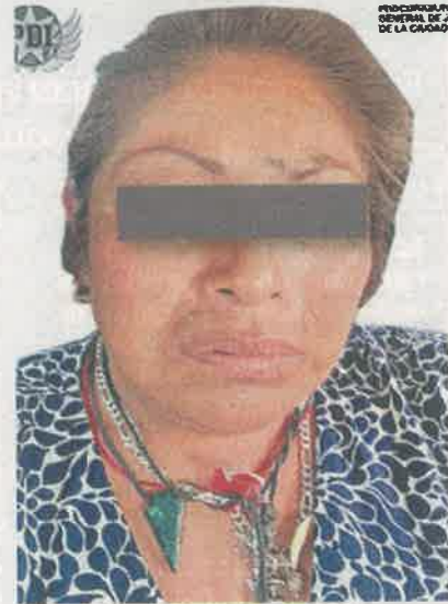
ROSTRO CUBIERTO POR LA AUTORIDAD

El estudiante chihuahuense fue plagiado al salir de clases y pese a que su familia pagó el rescate el joven fue estrangulado y localizado sin vida días más tarde en Xochimilco.