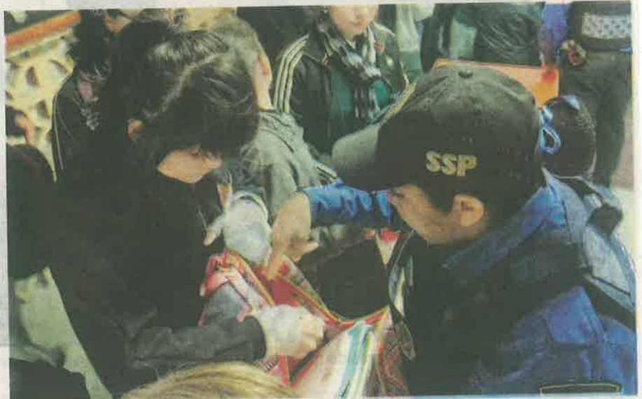
Tanto autoridades federales como locales decidieron no aplicar el programa Mochila Segura en el ciclo escolar 2019-2020

La lideresa del PT capitalino además declaró: "no podemos dejar solas a las au-