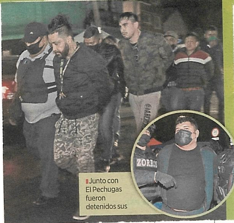
■ Junto con El Pechugas fueron detenidos sus

Por otro lado, en Flores Magón e Insurgentes, los policías ubicaron a una mujer y un hombre presuntamente con estupefacientes y una pistola.