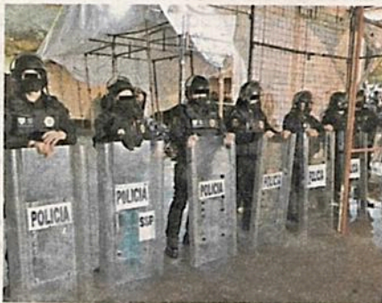
Intensa fue la movilización policiaca en Tepito

Una vez obtenidas las identidades de los señalados, agentes de la Policía de Investigación (PDI) examinarán bases de datos a fin de determinar si cuentan con antecedentes penales o si están relacionados con actividades ilícitas.