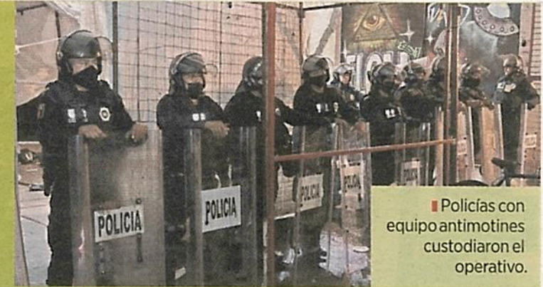
■ Policías con equipo antimotines custodiaron el operativo.

El dispositivo policial estuvo coordinado por la Secretaría de Seguridad Ciudadana y personal de la Fiscalía local. Además, hubo presen-