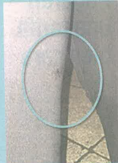
■ En una pierna le dio el balazo a la mujer.

“Referendo (la lesionada) que un policía se le va un disparo y posterior siente caliente su muslo izquierdo por lo que pide el apoyo”, agregó el reporte policiaco.