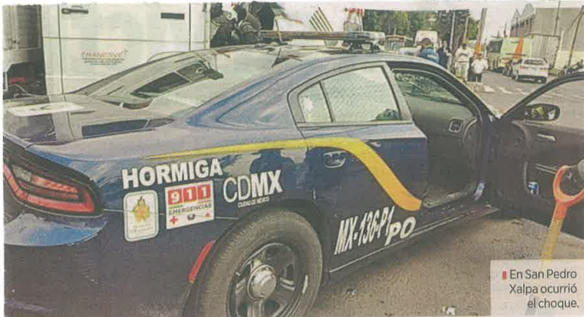
En San Pedro Xalpa ocurrió el choque.