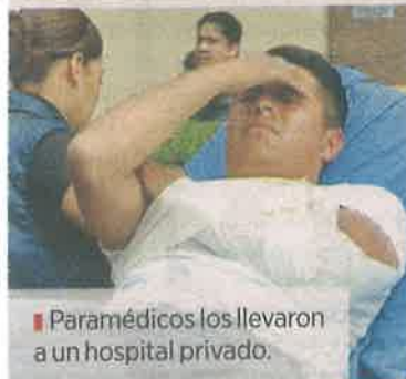
Paramédicos los llevaron a un hospital privado.