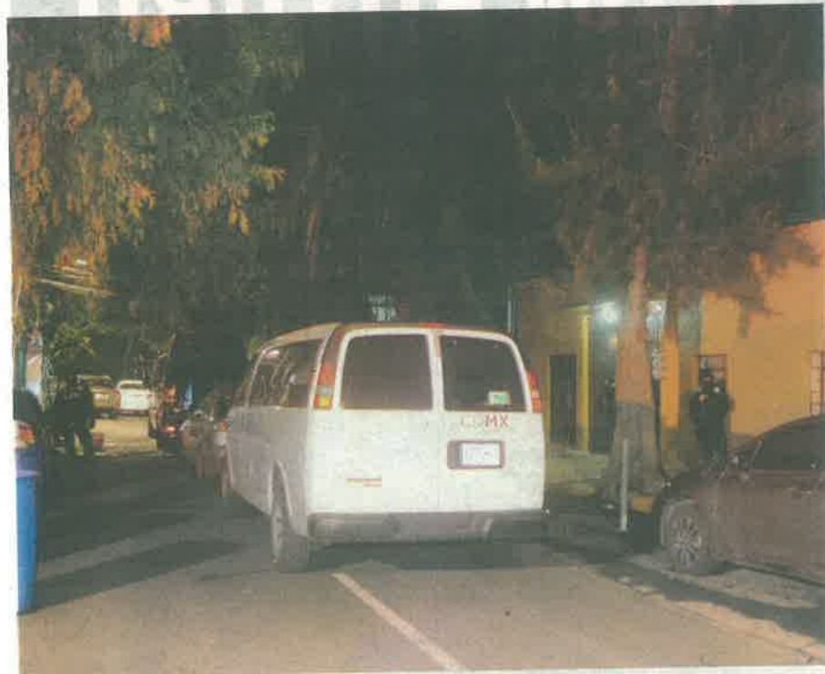
El inmueble registrado quedó a resguardo de elementos de la Procuraduría capitalina

El lugar fue cerrado y resguardado por elementos policiacos, en lo que se realizó dicho cateo. Del lugar fueron resguardadas algunas personas, al parecer ocupantes de este inmueble. Se espera que en las próximas horas, la Procuraduría informe a través de algún comunicado el motivo de esta diligencia y los resultados de dicha acción.