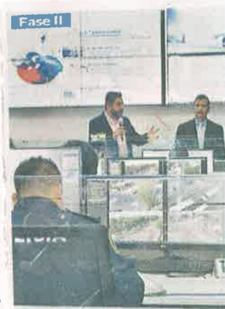
Las cámaras de la Alcaldía ya están vinculadas al C5.

“Asimismo se han instalado 13 mil alarmas vecinales y, diariamente, en coordinación con la Secretaría de Seguridad Ciudadana (SSC), se realizan operativos para evitar el robo de automóviles en la demarcación”, subrayó el Gobierno de la Alcaldía.