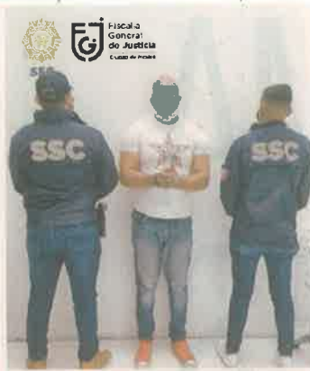
El Pelón fue aprehendido en la colonia San José del Olivar.