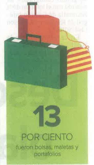
Gráficos: Horacio Sierra