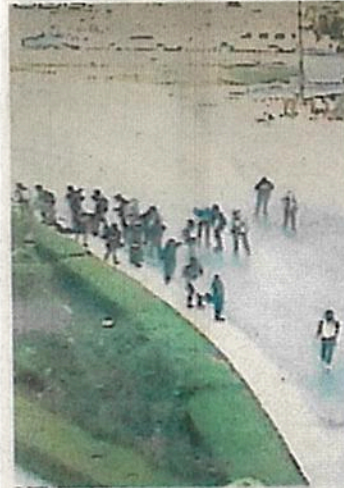
Las cámaras captaron la actividad de los manifestantes.

Vía radio entre los uniformados se pidió que ninguna unidad de la policía circulara por la zona para evitar conflictos con los encapuchados. ●