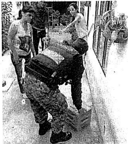
Personas de buen corazón la cuidaron en tanto llegó la ayuda

El personal de la BVA, al revisar al ave se percataron que se trataba de un Martín Pescador y lo trasladaron a sus instalaciones en la alcaldía Xochimilco, con el fin de resguardarla y ser valorada medicamente.