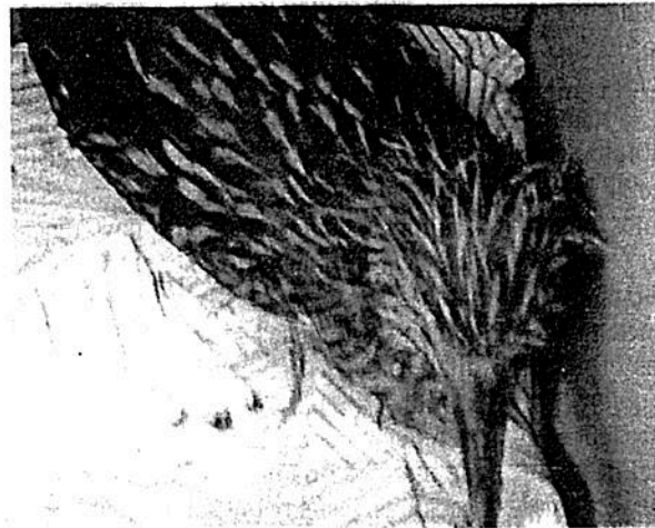
Esta ave fue puesta en manos expertas para su restablecimiento