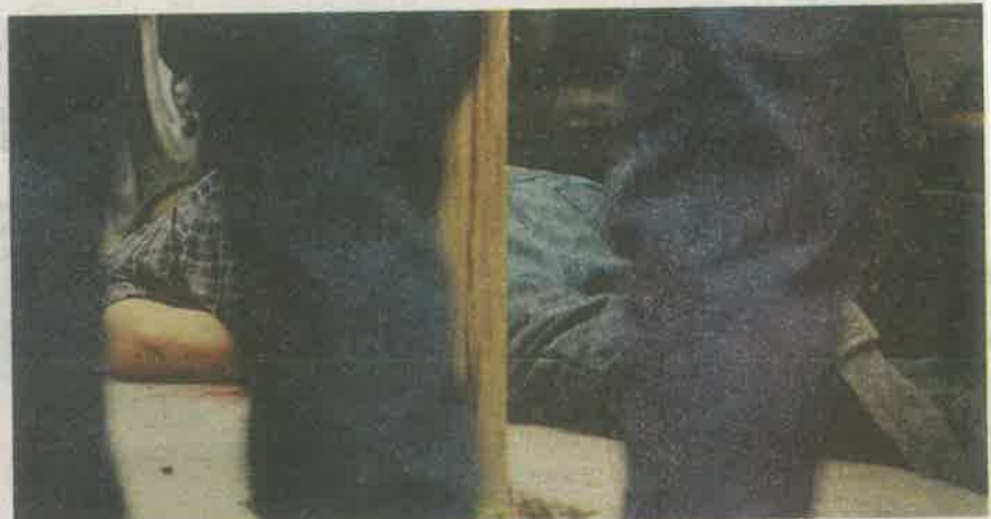
El hombre presentaba varios impactos de bala; quedó al lado de su vehículo

Minutos después, arribaron a la zona y examinaron el cuerpo del lesionado, el cual presentó varios impactos de proyectil de arma de fuego; luego de revisar signos vitales, los paramédicos corroboraron su muerte.