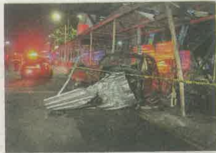
El automóvil quedó destrozado

Tras presenciar el percance, otros conductores frenaron su marcha y llamaron a los números de emergencia pa-