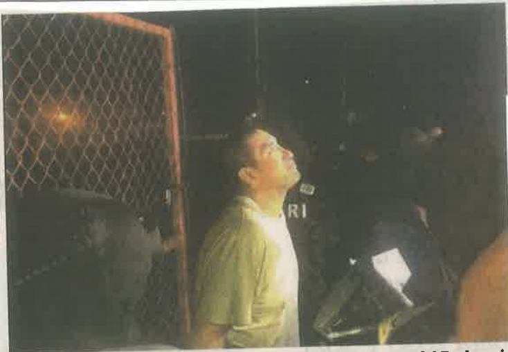
TOMADA DE VIDEO