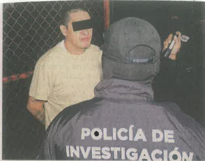
■ "El Lunares" fue arrestado ayer por homicidio calificado.