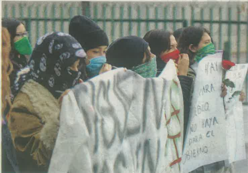
Los colectivos feministas rechazan ser víctimas constantes de la violencia