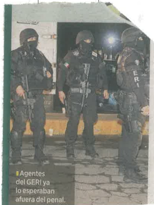
Agentes del GERI ya lo esperaban afuera del penal.