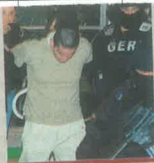
¿La tercera será la vencida?