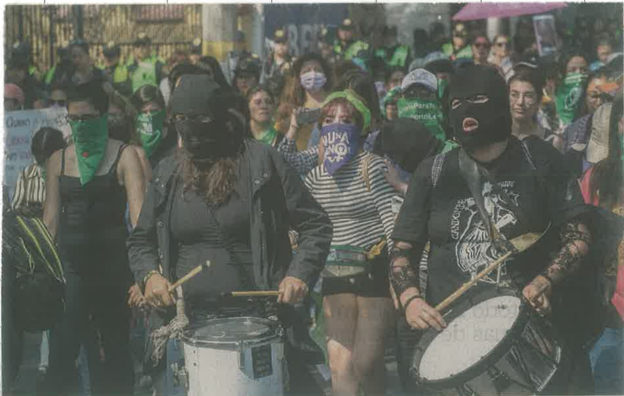
GERMAN ESPINOSA. EL UNIVERSAL

En Michoacán, un contingente marchó para condenar el asesinato de Ingrid y la difusión de las fotografías de su cuerpo. ●