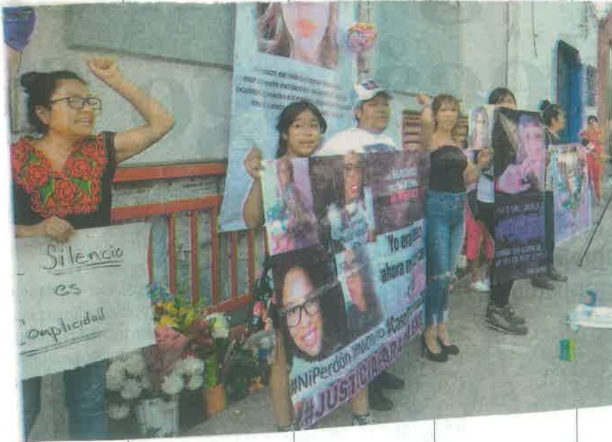
Ayer, colectivos feministas realizaron una movilización pacífica rumbo a la Colonia Vallejo, a fin de honrar la memoria de Ingrid "N"