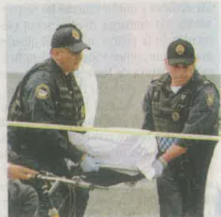
El cuerpo fue trasladado al anfiteatro para practicarle la autopsia de ley

Policías de investigación examinarán las cámaras de seguridad del Centro de Comando, Control, Cómputo, Comunicaciones y Contacto Ciudadano (C5) a fin de ubicar al responsable, así como su posible ruta de escape.