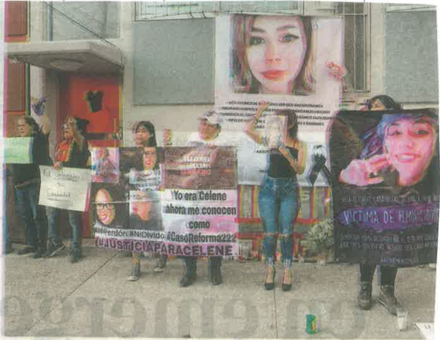
Frente al domicilio de Ingrid se realizó un mitin

Su tía reclamó a los diversos medios de comunicación la filtración de la imagen del cadáver Ingrid y demandó un alto al amarillismo entorno a la cobertura del fe-