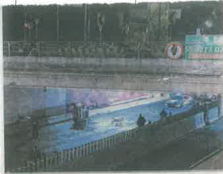
El accidente se registró durante la madrugada del sábado