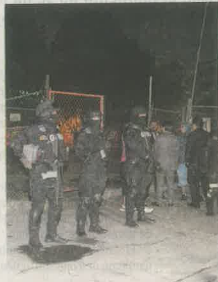
Elementos de la Policía de Investigación ya lo esperaban

Entre tanto, la Fiscalía General de Justicia de la Ciudad de México emitió un comunicado en donde externó su "absoluta inconformidad y total desacuerdo con la resolución tomada por un juez de control de la Ciudad de México, que ordenó la libertad de Oscar 'N'".