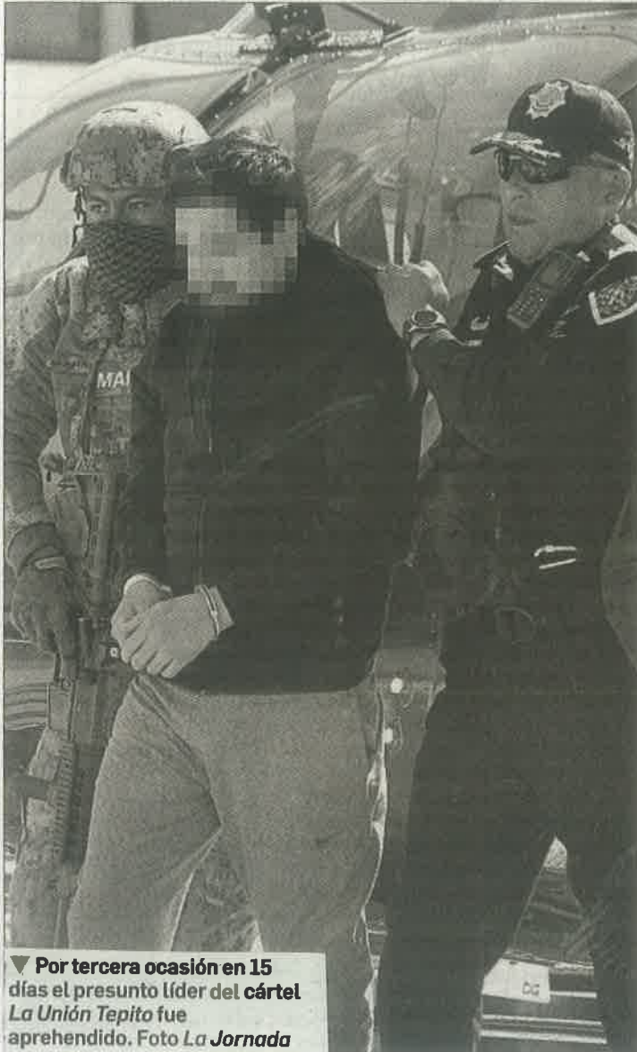
▼ Por tercera ocasión en 15 días el presunto líder del cártel La Unión Tepito fue aprehendido.

esta audiencia el próximo jueves, además de que acusó al gobierno capitalino de violar los derechos de su cliente y pretender exhibirlo como trofeo.