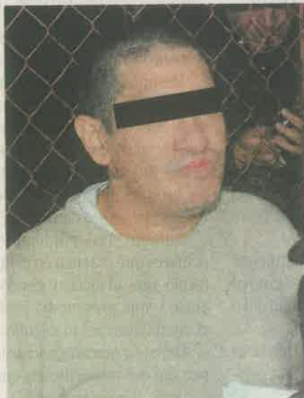
Homicidio es el nuevo delito por el que fue reaprehendido

A su salida del centro de reclusión -ubicado en la alcaldía Gustavo A. Madero- un contingente de agentes de la Policía de Investigación lo abordó. Uno de los uniformados le notificó sobre la nueva orden de aprehensión en su contra