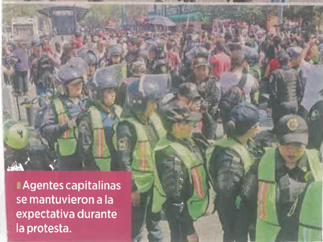
Agentes capitalinas se mantuvieron a la expectativa durante la protesta.