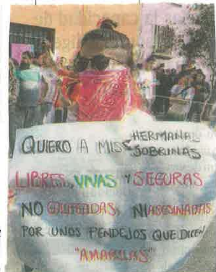
En el lugar estuvieron familiares de otras víctimas

Por ello, invitó a evitar la difusión de imágenes que lesionen la dignidad huma-