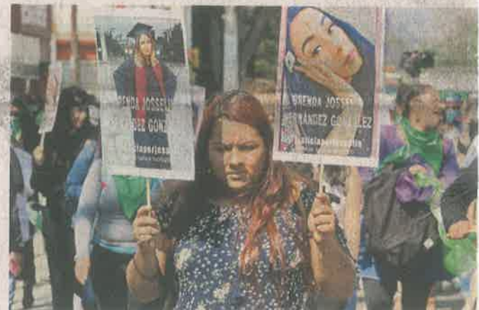
Las dolientes se plantaron frente a la inmueble ubicado en el 258 de Francisco Tamagno, Colonia Vallejo.