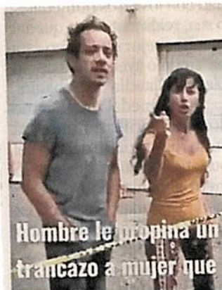
Hombre le propina un trancazo a mujer que