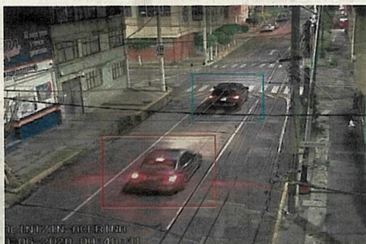
La SSC detectó el auto BMW de El Elvis y desplegó el operativo para atrapar al sujeto cuando fuera a recoger el vehículo estacionado.

Este personaje ya era investigado —con un seguimiento importante de parte de la policía capitalina—, pues es uno de los objetivos prioritarios de las autoridades al ser catalogado como el principal generador de violencia en la zona Centro, al tiempo que se le vincula en el secuestro de comerciantes y empresarios, incluso, las investigaciones revelaron que El Elvis planeó el plagio del sonorenses Héctor Pavlovich y dos víctimas más por quien recibió el dinero del rescate y las mató.