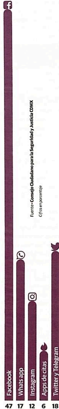
Cifras en porcentaje

La red social en la que fue difundida su intimidad sexual.