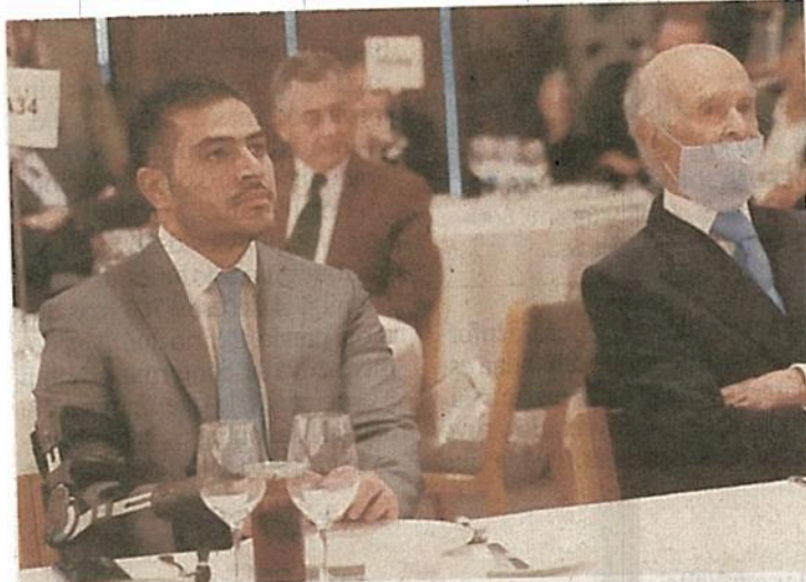
El secretario de Seguridad en la CDMX, Omar García Harfuch, reapareció tras el atentado para dar una conferencia en el Club de Industriales.