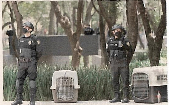
■ También, se echó mano de perros y un cordón policiaco.

García presume la detención de 52 cabecillas im-