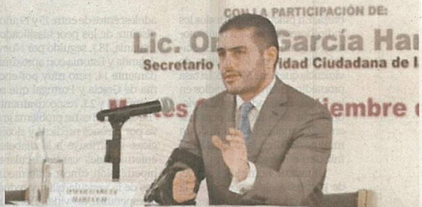
En reunión con empresarios, Omar García Harfuch aseguró que de la lista de 11 objetivos primordiales, faltan tres por detener.