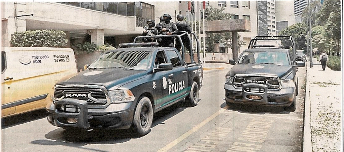
■ El dispositivo de seguridad alrededor del titular de la Secretaría de Seguridad Ciudadana consistió en patrullajes constantes.