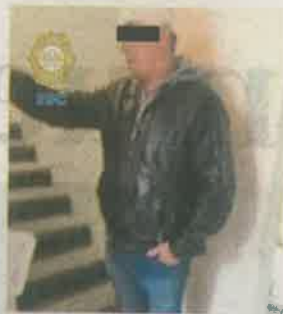
El conductor involucrado

Al llegar, los policías se percataron de un vehículo volcado a la altura del Anillo Periférico y Tecnológico de Monterrey, donde también se encontraba un poste derribado, lo que afectaba ambos sentidos de Anillo Periférico.