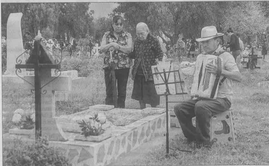
▲ Como marca la tradición, música que escuchaban los que ya se fueron.

La cifra aumentará hoy, cuando se espera mayor presencia de visitantes y los panteones estén abiertos hasta la seis de la tarde.