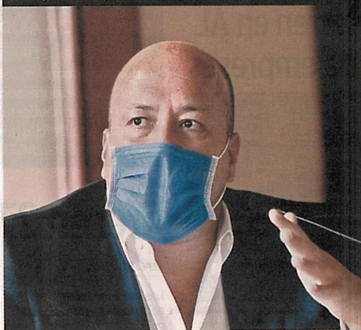
Enrique Alfaro, Gobernador de Jalisco

/// Después de lo que ha pasado, particularmente lo que sucedió en la CDMX, que el discurso del Gobierno federal cambiara, que se entendiera que la delincuencia organizada está queriendo poner contra las cuerdas al Estado mexicano y que, ante eso, no puede seguir el mismo discurso.