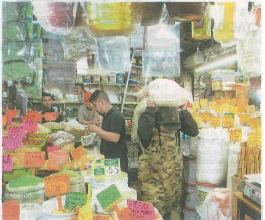
Zonas de gran venta son acosadas por quienes ofrecen créditos y hacen rifas

Sin embargo, estos centros de abasto están el ojo de personas que buscan dinero rápido y fácil, como es el caso ahora de rifas ilegales en las que el premio es dinero. El Sol de México publicó que esta modalidad se originó a iniciativa de un grupo de colombianos en el Centro Histórico, para ser específicos atrás de Palacio Nacional, donde convergen comerciantes estableci-