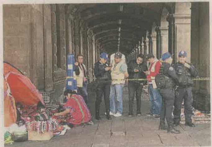
■ Policías cercan a vendedores con cintas de precaución y obstruyen el paso peatonal afuera de las sedes de Gobierno.

observó cómo los uniformados permitieron que grupos de jóvenes bailaran a cambio de monedas, ocupando tres cuartas partes del ancho de Madero, casi al cruce con Plaza de la Constitución.