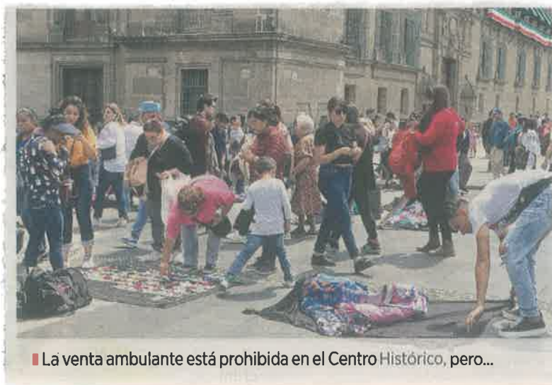
■ La venta ambulante está prohibida en el Centro Histórico, pero...

Los policías consultados por este diario defendieron que deben retirar "a cualquiera que estorbe" e, incluso, si sólo los ven "sospechosos" se les puede pedir que se vayan antes de ser remitidos.