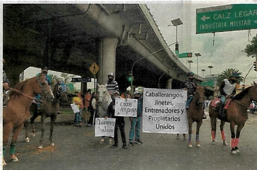
Jinetes, caballerangos y veterinarios bloquearon la lateral de Periférico