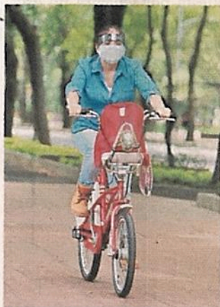
■ Cada vez más personas optan por la bicicleta.