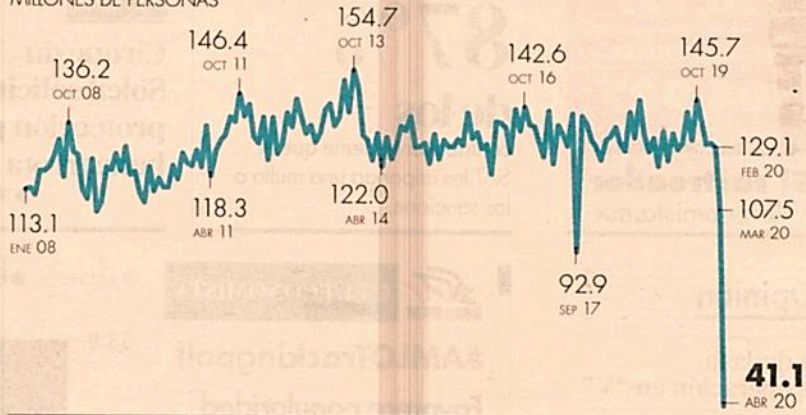
Pasajeros transportados en el Metro de la CDMX | MILLONES DE PERSONAS

En abril del 2020, el número de pasajeros transportados por el Sistema de Transporte Colectivo Metro de la Ciudad de México fue de 41.1 millones de personas, la cifra más baja desde 1986 año desde que se tiene registro. Asimismo, en el 2019 viajaron en promedio cada mes 133 millones de personas.