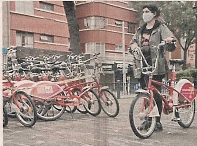
El call center del sistema funcionará las 24 horas del día.