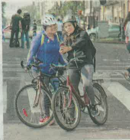
El objetivo es promover entre la ciudadanía opciones sustentables de transporte para movilizarse en las ciudades