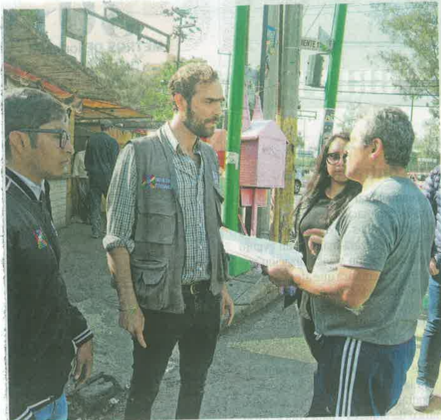
El secretario de Movilidad presentó avances en cruces peligrosos /ERNESTO MUÑOZ