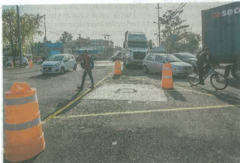
Con la intervención de cruces, la Semovi dijo que busca brindar mayor protección a los peatones en zonas con más incidentes viales.

Dijo que además se conectarán semáforos nuevos a la Dirección General de Tránsito y se pondrán más señalamientos. En los primeros 100 días de la actual administración, la Semovi ha intervenido y entregado 37 intersecciones, entre ellas, avenida Hidalgo, Chapultepec, San Simón Insurgentes y Buenavista. ●