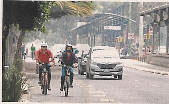
■ En la ciclovía de Insurgentes la hora de mayor tránsito es de 15:00 a 16:00 horas con 551 personas cada 15 minutos.

“Las ciclovías terminan siendo una inversión en salud pública, que disminuye los riesgos de contagio, reduce la ansiedad y permite la