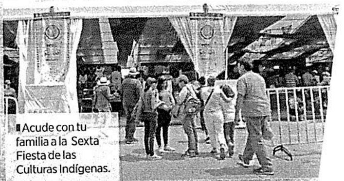
■ Acude con tu familia a la Sexta Fiesta de las Culturas Indígenas.