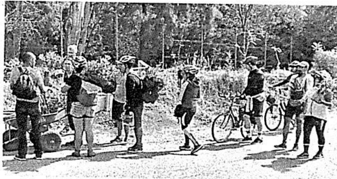
■ Ciclistas ruedan por la Ciudad con ejemplares verdes en la espalda, con el fin de encontrarles un lugar donde florecer.

Las macrorrodadas salen a las 7:00 horas de la Torre Caballito, en Paseo de la Reforma.