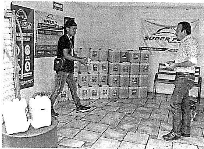
El etanol se vende sin medidas de Protección Civil.

mos identificado no sólo por la contaminación atmosférica, sino por el riesgo, porque hay venta de etanol en condiciones que incumplen con medidas de protección civil”, comentó Robles.