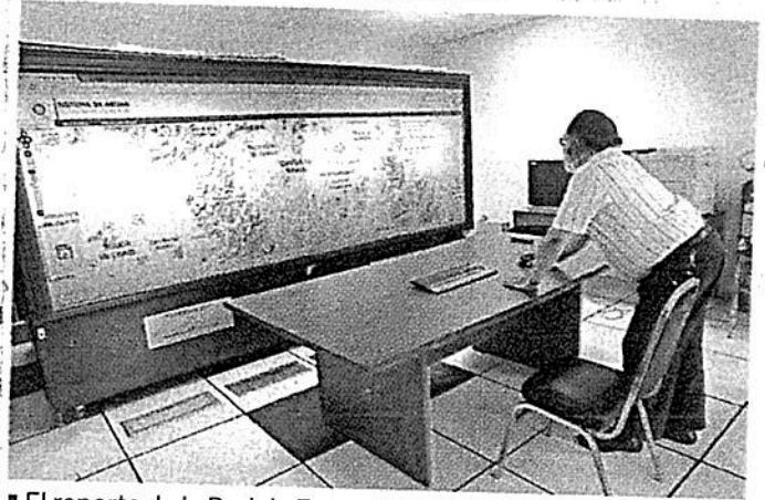
El reporte de la Red de Estaciones Pluviométrica se podía medir en el Centro de Mando de Sacmex por demarcación.

El Instituto de Ingeniería de la UNAM opera un Observatorio Hidrológico con un mapa que muestra los niveles de lluvia cada hora, en tanto “¿Dónde y cuándo está lloviendo?” mostraba las cantidades precipitadas.