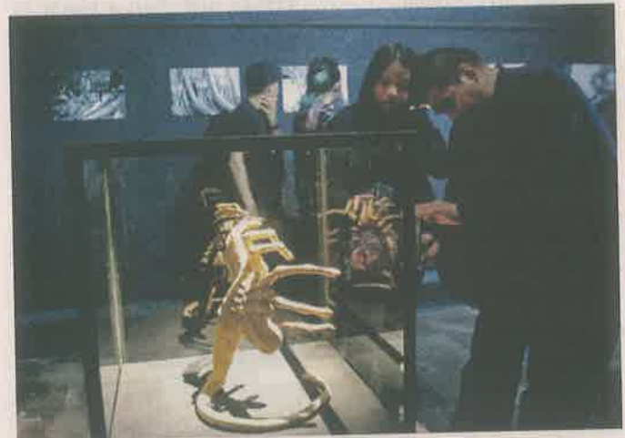
Maquetas y diagramas de cómo funciona el emblemático extraterrestre fascinan a los asistentes a la exposición.

Este montaje se realiza de forma paralela a la exposición de "Solo con la Noche" en una galería sobre la Avenida Reforma, la cual ha