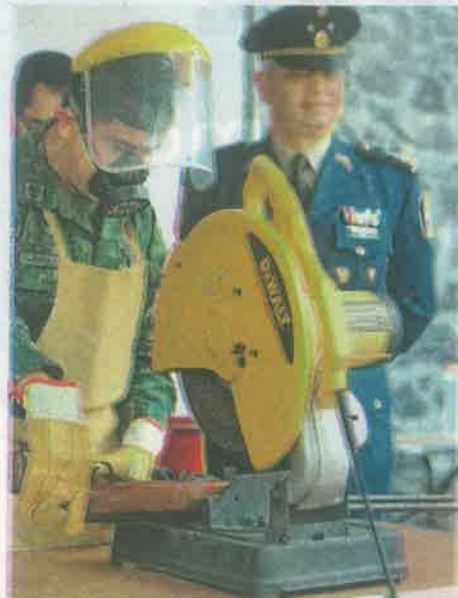
Las armas son destruidas por personal especializado

La funcionaria conminó a la ciudadanía a pasar la voz para que las personas se informen y acudan a alguno de los módulos que se instalan en los atrios de las parroquias de