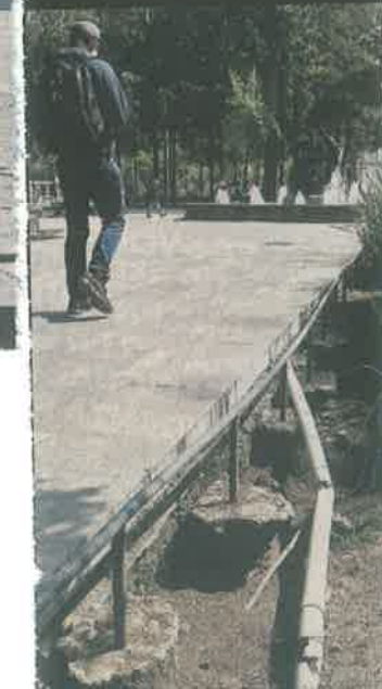
Mangueras con cableado aparecen expuestas.