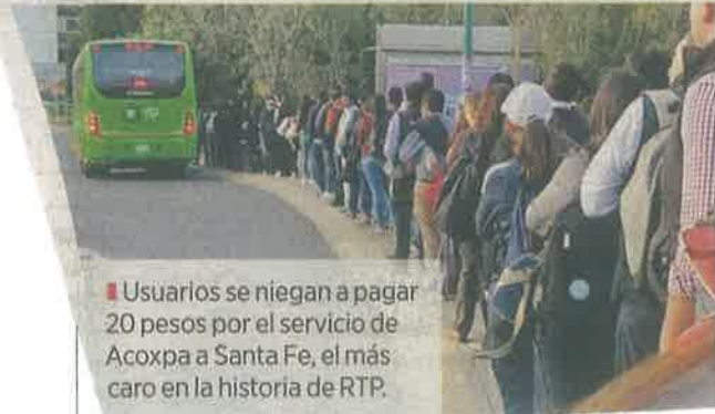
Usuarios se niegan a pagar 20 pesos por el servicio de Acoxta a Santa Fe, el más caro en la historia de RTP.

"No me siento segura. Imagínate, en verdad tengo miedo porque tienen mi foto, pero no por eso voy a denunciar", dijo a la par que agregó que ya levantó su queja en atención ciudadana.