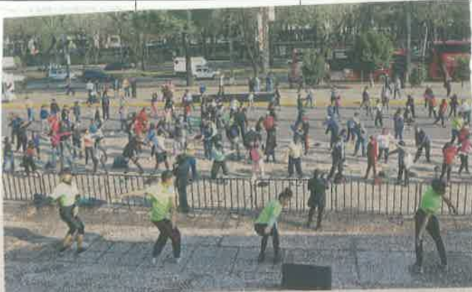
■ Diez bailarines y músicos pusieron en movimiento a un centenar de personas frente al Auditorio Nacional.