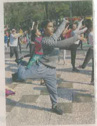
■ Busca acercar la danza contemporánea al público.

"Es un primer contacto de la danza contemporánea y la