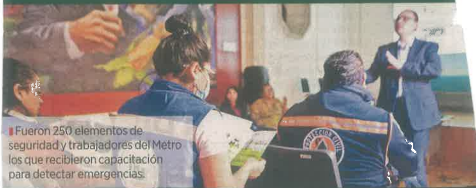
Fueron 250 elementos de seguridad y trabajadores del Metro los que recibieron capacitación para detectar emergencias.