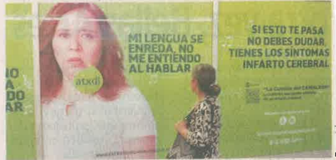
■ Crean protocolo “Guadalupe” para alertar de infarto cerebral.

En entrevista, reveló que el protocolo fue nombrado “Guadalupe” en memoria de la mujer que pasó más de 26 horas tirada a fuera de la estación ante la vista de usuarios y comerciantes sin que le brindaran ayuda.