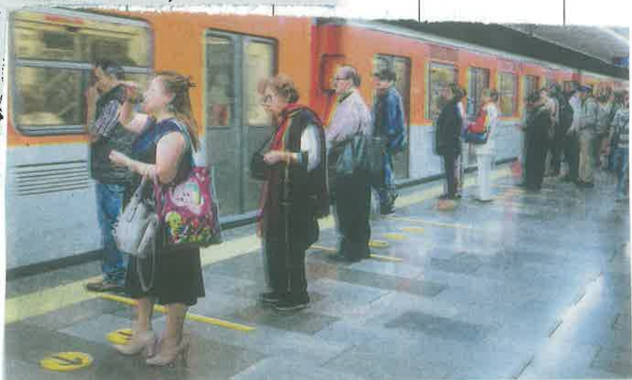
La capacitación fue dirigida a todos los empleados que tienen contacto con los usuarios

La intención de la muestra es que los usuarios conozcan los síntomas del infarto cerebral, como son el rostro endurecido en lado, dificultad para mover un brazo o una pierna o problemas en el lenguaje, así como los factores de riesgo para padecerlo: presión alta, obesidad y diabetes.