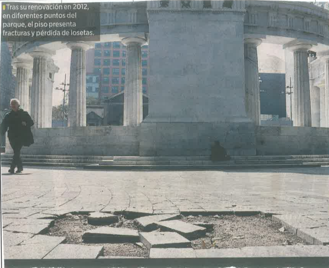
Tras su renovación en 2012, en diferentes puntos del parque, el piso presenta fracturas y pérdida de losetas.