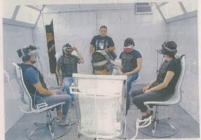
En una sala anexa los participantes viven 10 minutos de adrenalina pura. La sesión no es apta para personas cardiacas.

sido exhibida en diferentes países y se realiza en colaboración con la Secretaría de Cultura de la Ciudad de México.