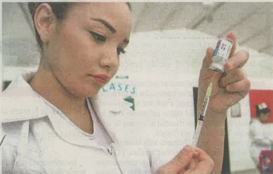
La Organización Mundial de la Salud define como vacunas a cualquier preparación destinada a generar inmunidad contra una enfermedad

Según datos publicados por el Centro Nacional para la Infancia y Adolescencia -refirió-, entre los años 2010 a 2014 se in-