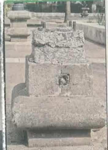
El mobiliario urbano presenta daños evidentes.