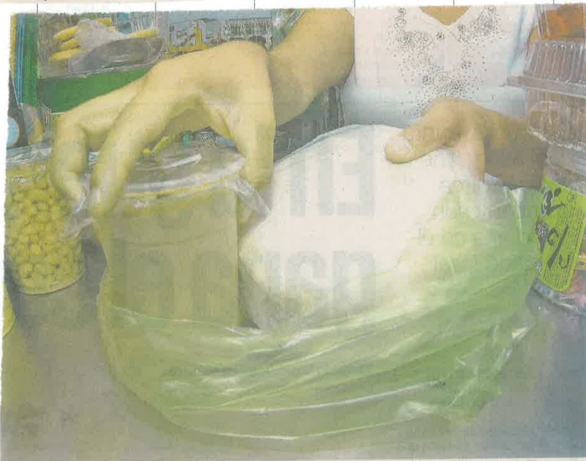
Los pequeños comerciantes enfrentan el reto de convencer a su clientela de que la prohibición de entregar bolsas de plástico es por el bien de todos. Los adultos mayores son los que más se oponen a la medida.

Reconoció que son positivos los esfuerzos, pero será un proceso que llevará bastante tiempo para llegar a la reducción efectiva de plásticos de un solo uso. Dijo que las bolsas representan una pequeña parte de los plásticos que están en el ambiente y la nueva ley atiende a 10% de los desechos de este material. ●