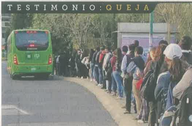
■ Usuarios se quejan por la demora que presenta el servicio público en comparación con los camiones privados.