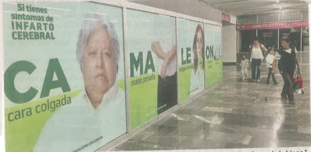
■ El STC busca sensibilizar a los usuarios con una campaña en la estación Tacubaya de la Línea 1.