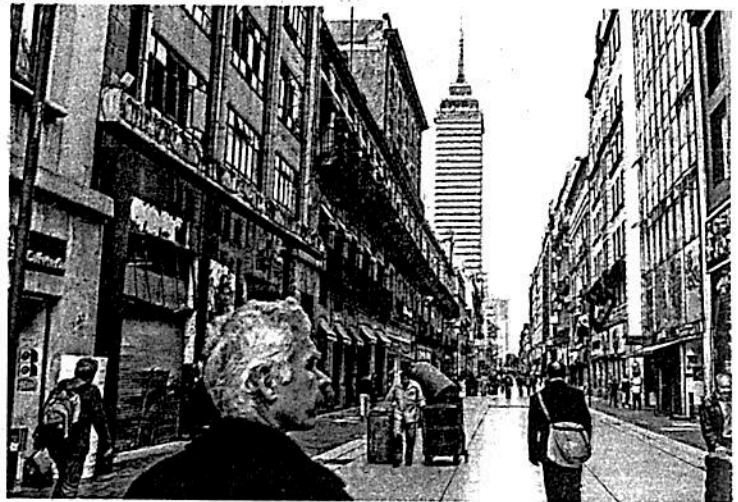
La austeridad ha ido impactando poco a poco en todos los sectores.

Señaló que el tema de la confianza es un valor fundamental en la inversión y el