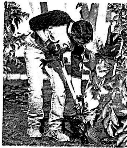
Reforestarán la Ciudad de México a través del Reto Verde

Los sábados de tequio también serán aprovechados a partir de este fin de semana y durante diez jornadas hasta alcanzar un total de 500 mil plantas.