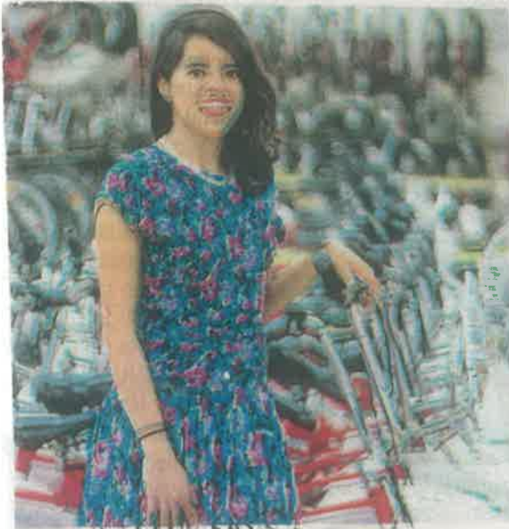
Gráfico: Rodolfo Gómez

Fernanda Rivera señala que es un sistema con- solidado como medio de transporte