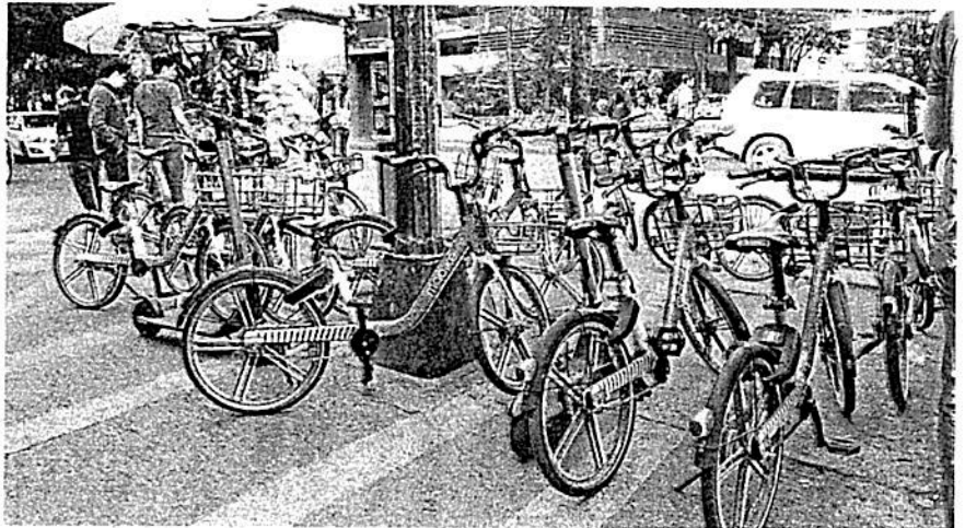
La empresa pidió a las autoridades pagar a plazos

Semovi informó que la empresa manifestó tener solvencia para pagar 2,600 pesos por unidad