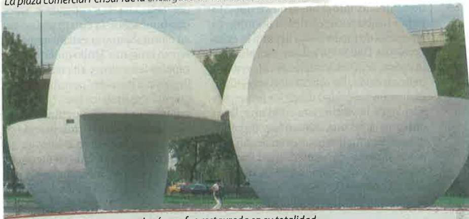
La estación 5, que representa a Japón, ya fue restaurada en su totalidad.