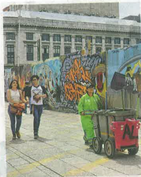
Fueron convocados 34 artistas para este proyecto/DANIEL HIDALGO

El objetivo, además de celebrar los 85 años del Palacio de Bellas Artes, es eliminar el graffiti vandálico de los muros del Centro