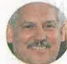
Víctor M. Villalobos

Un tema que va a crecer es el ingreso ilegal de ganado centroamericano a México. Tan es así, que la Guardia Nacional ya implementa un cinturón de control para evitar la entrada de cabezas que, estima el secretario de Agricultura, Víctor Manuel Villalobos, es de un millón al año. Hay riesgo sanitario para los mexicanos, y podría derivar en conflicto con EU si no se frena.