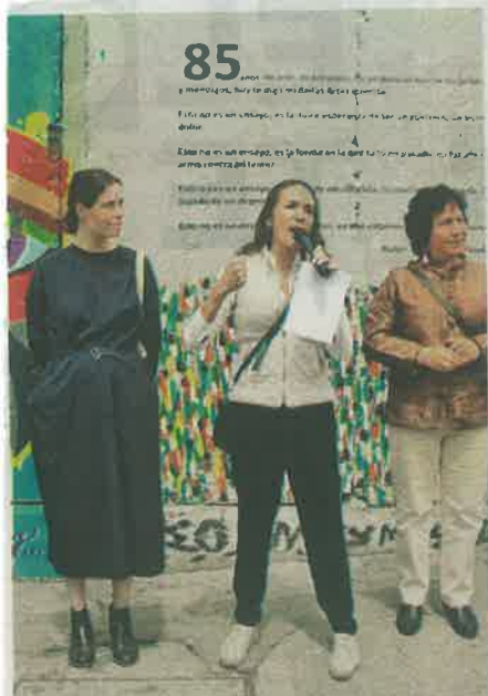
El mural fue realizado por artistas urbanos en coordinación con el INBA