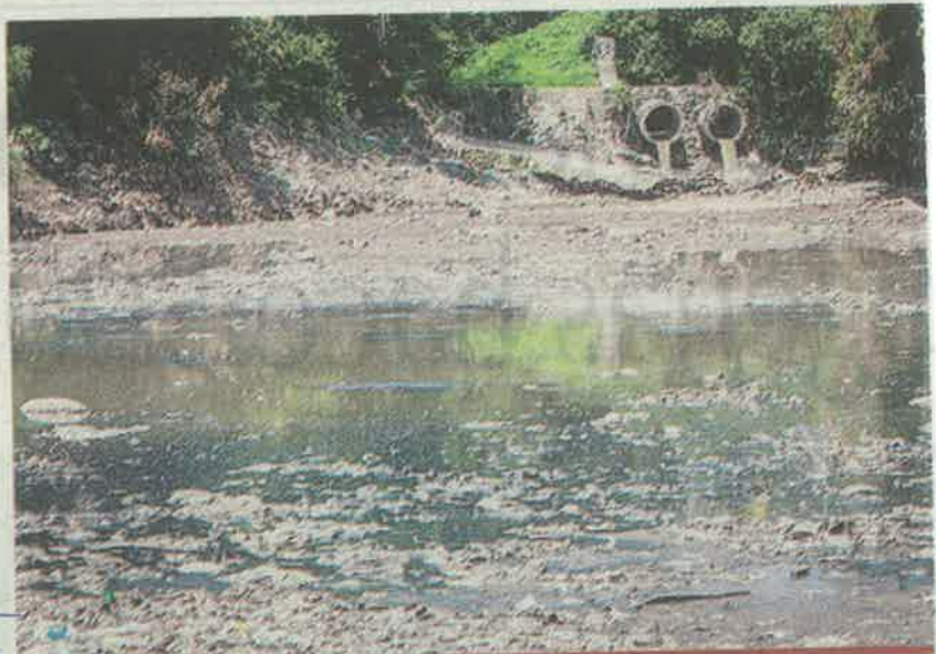
El Río Mixcoac se ha convertido en un sitio para arrojar basura y desperdicios.

Así como la recuperación del manto freático de la cuenca del río