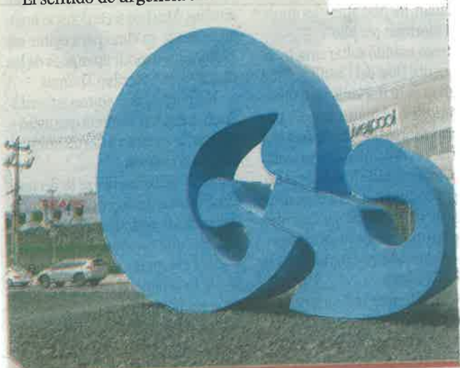
La plaza comercial PeriSur fue la encargada de remodelar esta escultura.

Los países participantes fueron Checoslovaquia, Bélgica, Austria, Polonia, Estados Unidos, España, Japón, Holanda y Australia.