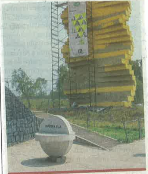
Las esculturas están siendo repintadas.

Es así como los monumentos Las Tres Gracias , Tertulia de Gigantes , Hombre de Paz , El Sol Poniente y México , fueron adoptadas por empresas y embajadas como Bancomer, American Express, Pirelli, Adidas y Perisur.