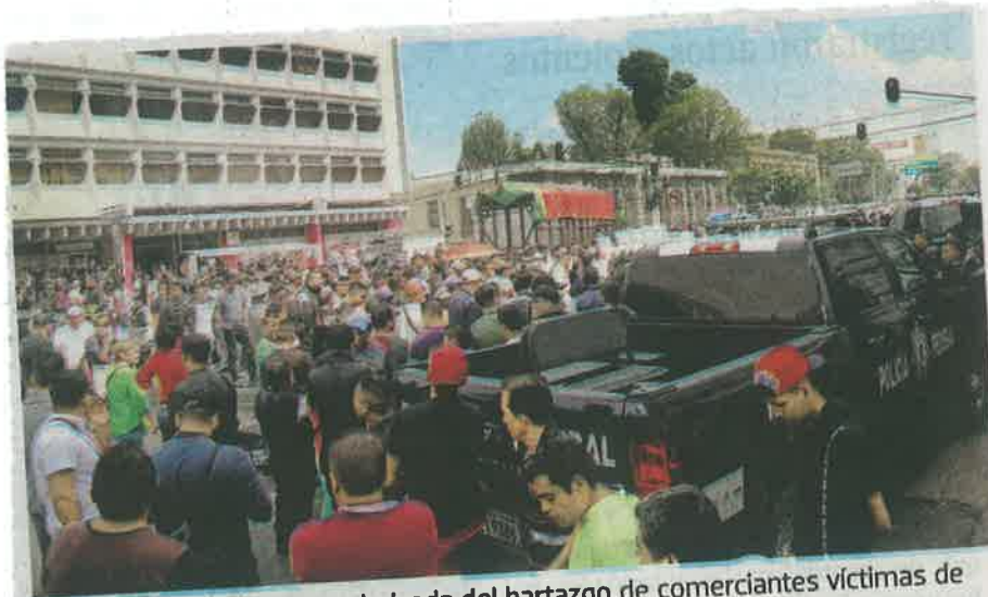
Se armó tremenda gresca derivada del hartazgo de comerciantes víctimas de supuestos abusos policíacos

lito permaneció junto a su local comercial.