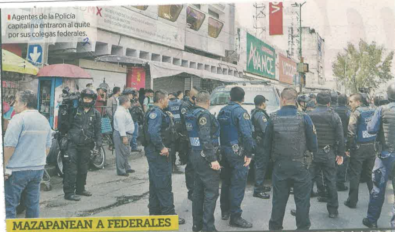
MAZAPANEAN A FEDERALES

Agentes de la Policía capitalina entraron al quite por sus colegas federales.