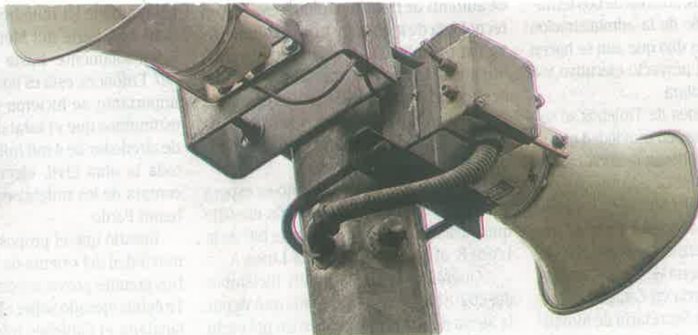
La población debe mantenerse informada a través de medios oficiales, a fin de evitar confusiones y pánico

Aprovechó lo suscitado y publicó una infografía en la que se destaca que los sismos son impredecibles y que, para protegerse, es necesario practicar simulacros frecuentemente para saber qué hacer ante algún movimiento telúrico.