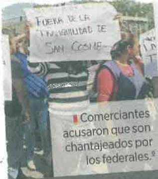
Comerciantes acusaron que son chantajeados por los federales.

60 policías preventivos arribaron para rescatar a la PF que quedó acorralada