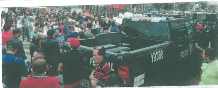
Gran movilización provocó el altercado entre ambulantes y policías