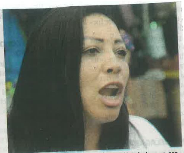
Esta vendedora denunció la extorsión de la que era víctima y que le quitaron documentos personales