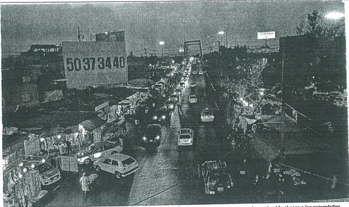
La policía capitalina resguarda Anillo Periférico antes de Calle 7 para evitar que el transporte de carga se estacione e impida el paso a los automóviles.