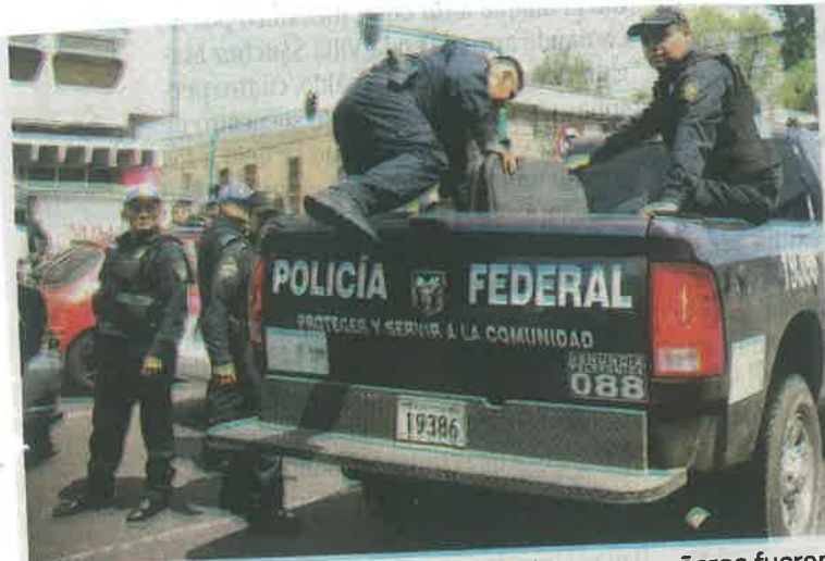
Policías federales llegaron a la zona donde sus compañeros fueron agredidos por vendedores

Se espera que en las próximas horas, las autoridades capitalinas recolecten testimonios de la parte afectada así como de los cuatro policías federales señalados por su presunta participación en el delito de extorsión.