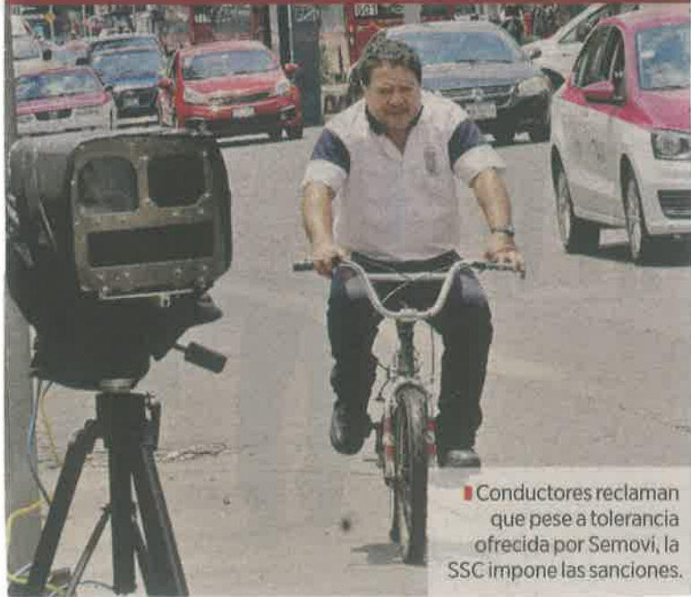
Conductores reclaman que pese a tolerancia ofrecida por Semovi, la SSC impone las sanciones.

Conductores reclaman que a pesar de la tolerancia ofrecida por la Semovi, la SSC impone las sanciones correspondientes por fotocívicas a partir de que se superan los límites de velocidad marcados por el Reglamento de Tránsito.