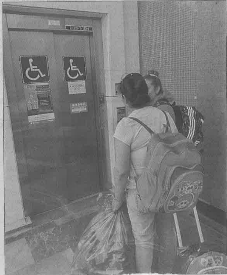
► Parece que la carga vuelve discapacitados a los usuarios del Metro que abusan del elevador.