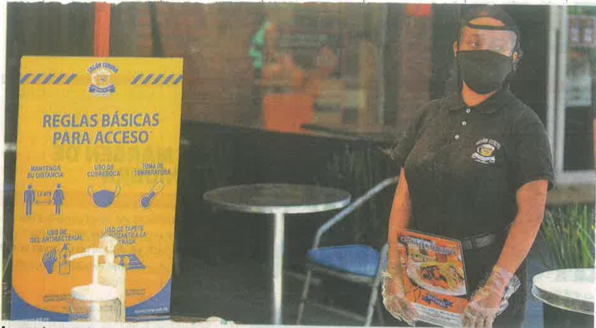
Las mujeres trabajan en lugares donde hay más contacto de persona a persona, por lo que son los empleos con mayor riesgo de contagio