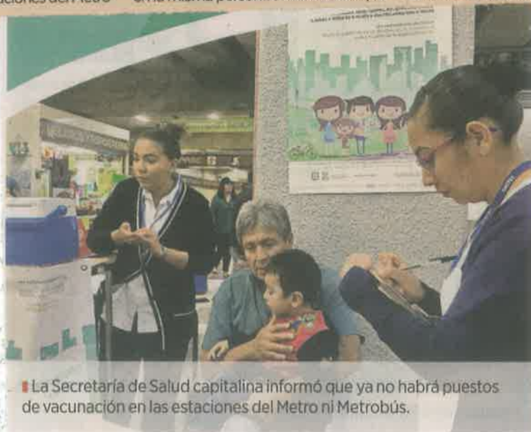
La Secretaría de Salud capitalina informó que ya no habrá puestos de vacunación en las estaciones del Metro ni Metrobús.

Para este 2019 se estima que predominen casos del tipo H3N2.