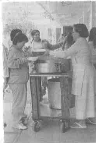
■ A diario, en los reclusorios se sirven 35 mil 206 raciones.

La misma empresa abastecía alimentos en los penales federales.