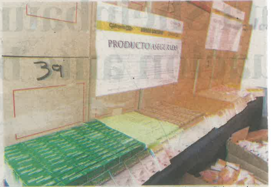
La venta de medicamentos de dudosa procedencia en lugares distintos a las farmacias es el principal riesgo sanitario en la Ciudad de México

La autoridad sanitaria, en colaboración estrecha con otras dependencias, como son la Secretaría de Economía, Seguridad Ciudadana y Procuraduría de Justicia, deben mantener operativos permanentes,