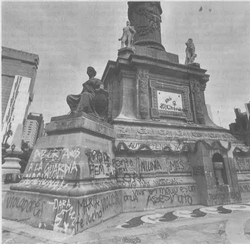
Las pintas realizadas durante la marcha del pasado 16 de agosto permanecen en el monumento.