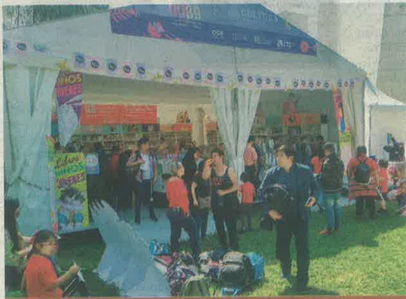
La FILIJ ofrecerá más de 600 actividades hasta el 18 de noviembre.