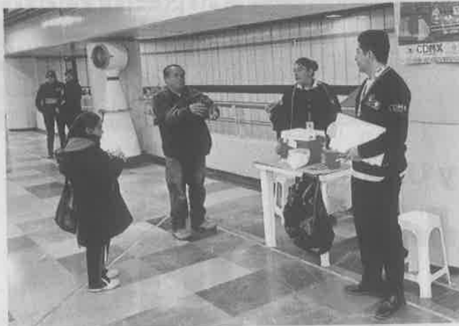
Los módulos de vacunación que cada año se colocaban al interior de estaciones del Metro brillarán por su ausencia.

En entrevista, el funcionario expuso que la campaña masiva que instauró desde 2009 -cuando en la Capital se registró una pandemia de influenza AH1N1- no ha sido eficiente porque, aunque se ha vacunado a un importante número de personas, no ha