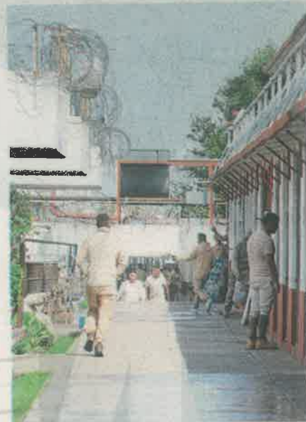
Los reclusos aprenden oficios que les servirán cuando estén en libertad