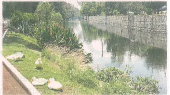
El Canal Nacional es uno de los espacios a proteger.

“No solamente es la cuestión de garantizar la recarga para futuras generaciones, sino todo el entorno que generan estos cuerpos, el entorno, las condiciones de comunidad a través de la apropiación de estos espacios”, añadió De la Rosa.