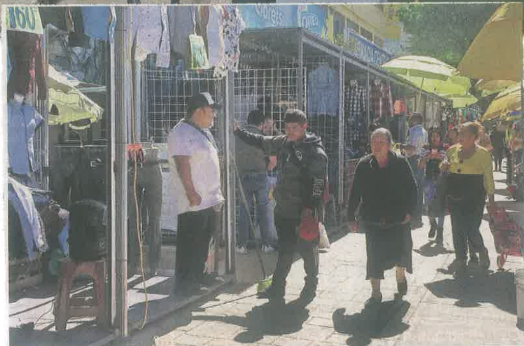
Algunas de las nuevas estructuras, aún sin acabar, ya son ocupadas con mercancía.

Pese a que la acera en Eje Vial 1 Oriente es renovada, comerciantes informales de La Merced aprovechan las nuevas plataformas peatonales para instalar, hasta ahora, 50 estructuras metálicas.