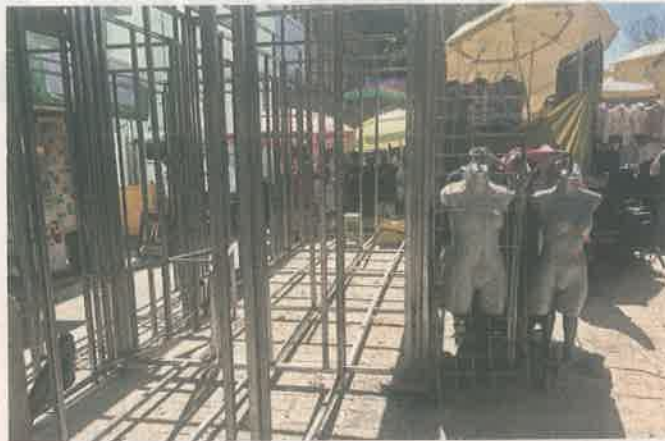
La renovación de banquetas es aprovechada para proceder con la instalación de los nuevos puestos fijos.

"Yo pago renta, luz, agua, impuestos, doy facturas. Es increíble cómo este Gobierno les alquila la banqueta, digo, les alquila, porque aquí pasan diario los inspectores de la Alcaldía Venustiano Carranza y de la Secretaría de Gobierno de la Ciudad y cómo no van a darse cuenta",