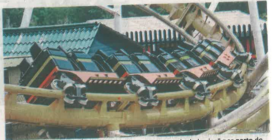
Muchos grupos de "ferieros" han acusado una "cacería de brujas" por parte de las autoridades al grado de clausurarles sus espacios de trabajo

Explicó el diputado de Acción Nacional que los dueños de juegos mecanismos deberán ahora someterse a lineamientos obli-