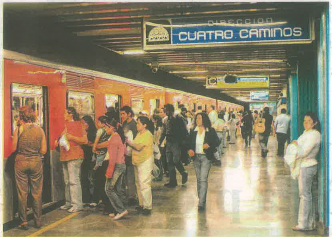
Las autoridades buscan aumentar recursos para el Metro, ya que es la columna vertebral de la movilidad en la ciudad.

nerar, el recurso es unitario y de ahí que las necesidades son infinitas y el recurso es limitado. Reconocemos ampliamente que podríamos ir área por área y encontrar deficiencias, la asignación es hasta donde se ha considerado bajo los lineamientos que son los más adecuados”.