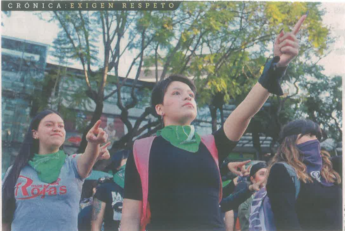
Mujeres de diferentes edades condenaron los mensajes de burla que se han viralizado en internet y minimizan su movimiento.