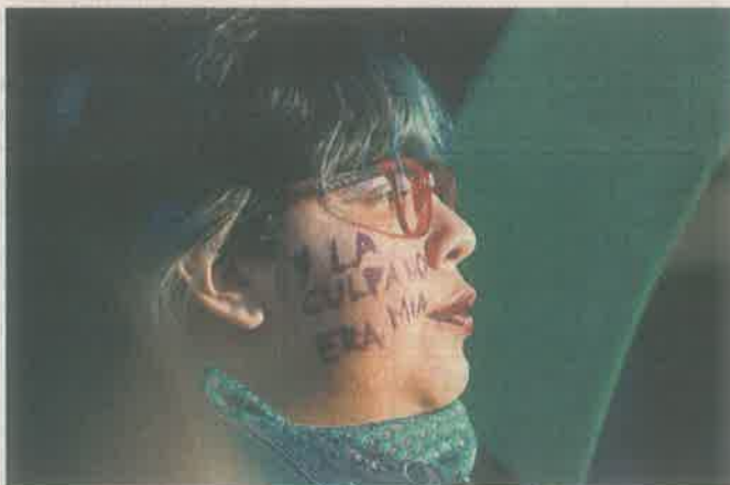
■ Algunas participantes mostraron sus rostros con mensajes de apoyo a víctimas y, la mayoría, portó la pañoleta proaborto.