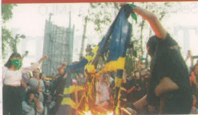
En la CDMX las manifestantes quemaron una bandera del club de fútbol y realizaron un acto político contra la violencia de género.