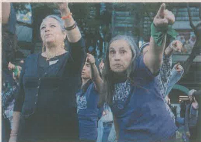
■ Durante el performance de lo que se convirtió en el nuevo himno feminista, mujeres pidieron acciones gubernamentales.

“En vez de estar cuestionando las actitudes (...) hay que estar cuestionando a la Jefa de Gobierno, hay que estar cuestionando qué está haciendo para ayudarnos”.