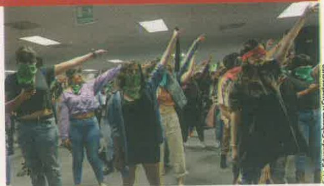
En la FIL de Guadalajara, al menos 200 mujeres hicieron el performance . Al final, algunas quemaron libros.