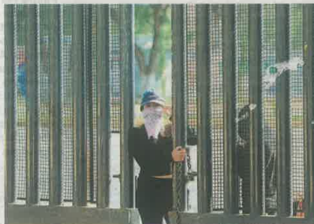
Las estudiantes denunciaron que hay profesores que incurrir en violencia de género

OCASIONES han cerrado el plantel, las autoridades no han dado respuesta a sus demandas