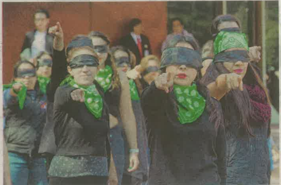
La Comisión de Derechos Humanos de la Ciudad de México (CDHCM) se suma al performance global contra la violencia de género

Este movimiento inició en Chile con "LasTesis", colectivo interdisciplinario de mujeres, quienes dieron vida a este mensaje con el objetivo de tomar tesis de autoras feministas y traducirlas a un formato performativo que llegara a múltiples audiencias.