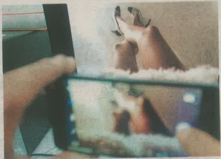
El aumento de la violencia contra la mujer en línea se dio en proporción a la popularización del uso de Tecnologías de la Información y Comunicación

Las formas de violencia contra la mujer en línea más comunes son, según un estudio realizado por el Instituto de