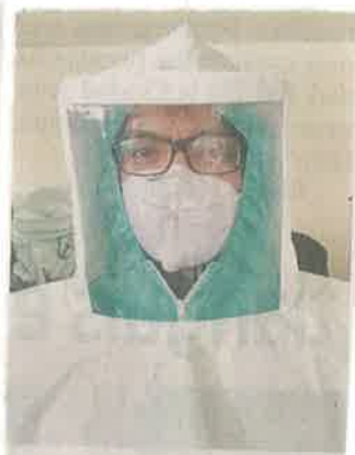
La fundación a donado mil 260 casacas.

Tres semanas después, las casacas llegaron a los seis hospitales públicos de Cancún y a algunos de la CDMX, como el Escandón, el de Oncología, Xoco, el Regional de Tlalnepantla y el General de Naucalpan, así como el Siglo 21, Troncoso, La Raza y Carlos Mac Gregor, del IMSS.