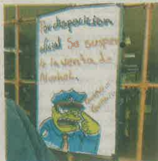
En otras alcaldías venden de día

La ampliación a la prohibición de venta de bebidas alcohólicas, es para evitar fiestas, eventos y reuniones