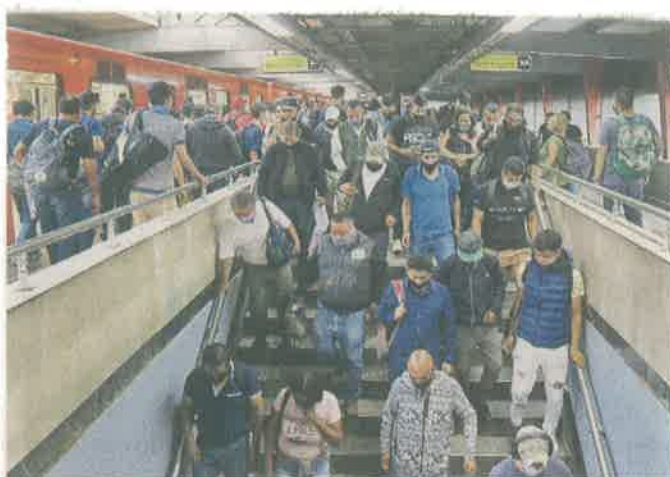
El transporte masivo es uno de los rubros que aún se deben revisar desde una perspectiva transversal y metropolitana.