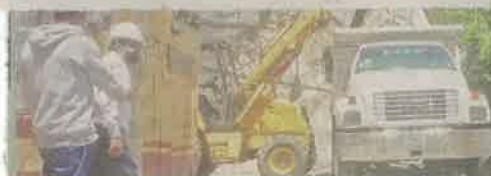
■ Con maquinaria pesada y un camión materialista se removían los escombros.