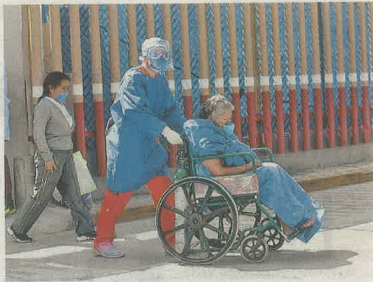
Paciente de covid-19 entra a clínica de CdMx. OMAR FRANCO

El Instituto Mexicano del Seguro Social fue el organismo que más recursos adicionales destinó a inversión física en hospitales e insumos, pues de los 280 millones de pesos que tenía previsto ejercer durante ese mes pasó a gastar un total de mil 320 millones de pesos, un incremento de