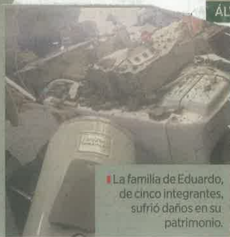
■ La familia de Eduardo, de cinco integrantes, sufrió daños en su patrimonio.