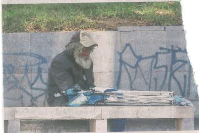
■ Al estar subestimadas las tasas de desocupación entre la población los niveles de vulnerabilidad aumentan.