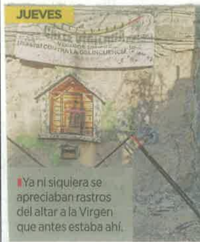
■ Ya ni siquiera se apreciaban rastros del altar a la Virgen que antes estaba ahí.

Desde hace tiempo se empezó a cuartear, pero hace unos días se puso peor y en estos días le dije a mi mamá 'ese muro ya no va a aguantar' y mi voz fue de profeta".