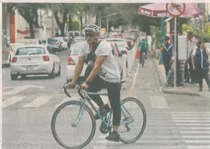
El impulso de la bicicleta es uno de los aspectos destacables, aunque aún hay mucho por hacer en la materia.