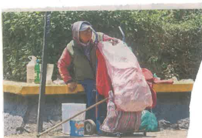
■ Una renta básica universal ante el aumento población en pobreza podría ayudar a enfrentar en problema.