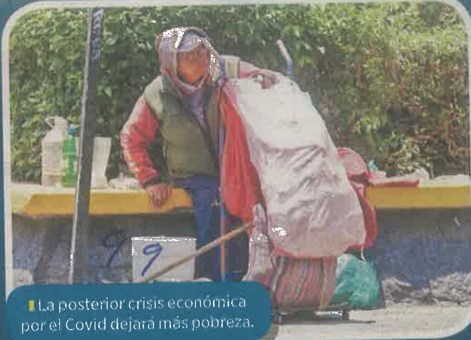
La posterior crisis económica por el Covid dejará más pobreza.