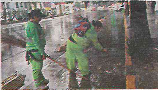
Faena nocturna de trabajadores de limpia