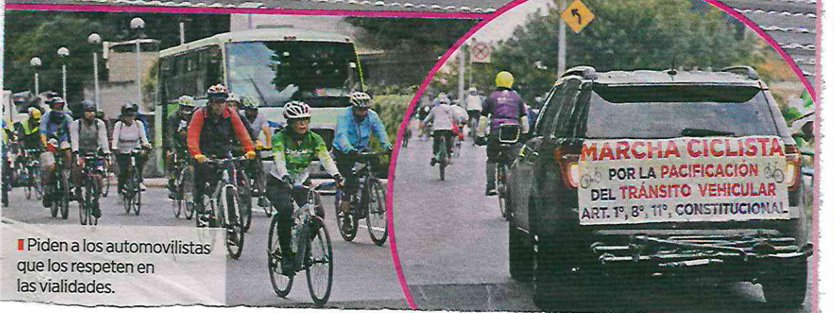
Piden a los automovilistas que los respeten en las vialidades.

MARCHA CICLISTA POR LA PACIFICACIÓN DEL TRÁNSITO VEHICULAR ART. 1º, 8º, 11º, CONSTITUCIONAL