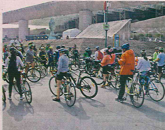
Las opiniones de los automovilistas se dividieron entre quienes alentaban a los ciclistas con el claxon y otros que los insultaban.

autobuses y un carro rebasó muy rápido por ahí para pasarse y me atropelló, me aventó”, dijo.