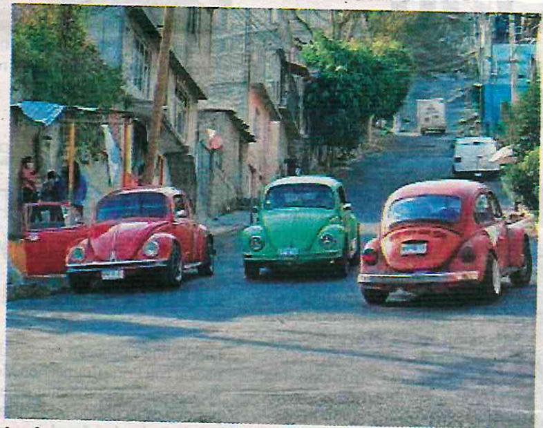
Los famosos vochos piratas en la alcaldía Gustavo A. Madero deberán registrarse para circular.

La Secretaría de Movilidad, en coordinación con la Secretaría de Seguridad Ciudadana y la alcaldía, Gustavo A. Madero, inició una estrategia de diagnóstico para el registro e identificación de los Vochotaxi que circulan en la colonia Cuauhtepac, éste consiste en colocar un número de identificación a los vehículos Volkswagen.