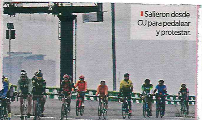
Salieron desde CU para pedalear y protestar.

Tras dos horas y media y 46 kilómetros recorridos, la rodada retornó hacia Periférico para entrar por el Memorial de Víctimas del Edomex y finalizar su itinerario en el Auditorio Nacional.