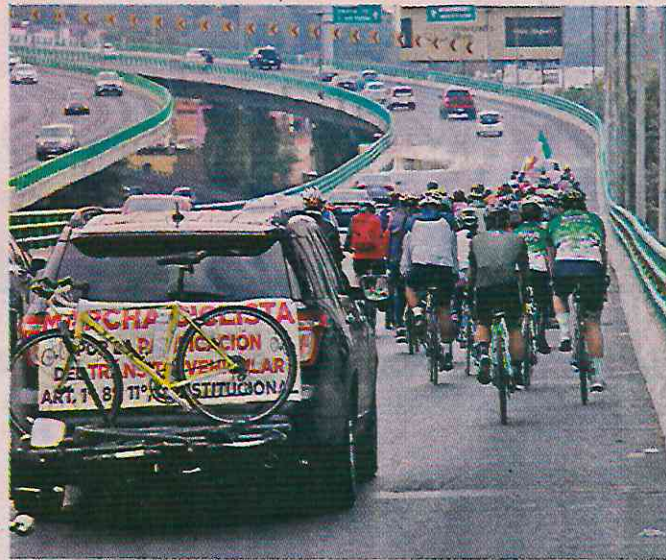
El contingente de pedalistas se abrió paso a la Autopista Urbana Norte, donde derribaron la pluma de la caseta de peaje.

“Me tocó un semáforo en siga. Avancé y los carros ya estaban detenidos, pero había un carril vacío de contraflujo donde solo pueden pasar los