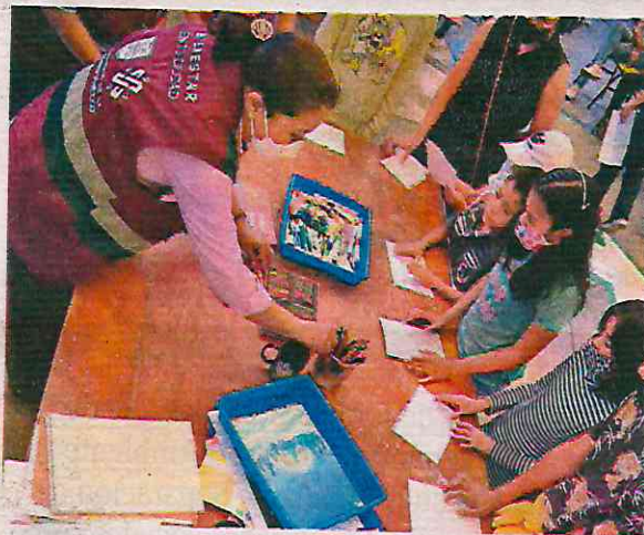
Proporcionarán servicios de cuidado y atención de niños menores de seis años

En lo que va de la presente administración niñas y niños han recibido servicios de cuidado y atención en los Caci Comunitarios, con financiamiento del sector público.