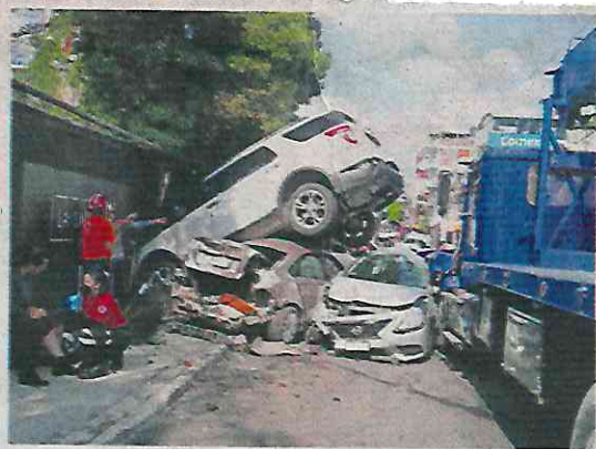
Durante el segundo trimestre de este año se elevaron 45% el número de lesionados en accidentes viales.

“Las tendencias tanto del segundo trimestre como del primer semestre indican reducciones en el porcentaje de muertes por atropellamiento, pasando de