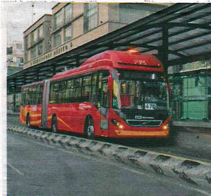
A partir del 26 de septiembre, Metrobús incorpora rutas cortas a su servicio habitual.

Con dichas acciones, Metrobús favorece las alternativas de movilidad que busca un servicio de transporte de calidad, digno y seguro para todas las personas.