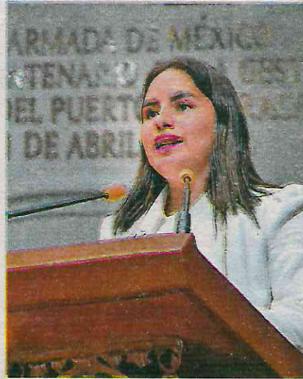
La diputada propuso que cualquiera de los contrayentes pueda solicitar la nulidad del matrimonio