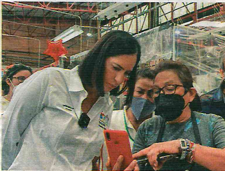
La alcaldesa Lía Limón en el recorrido de mercados en ÁO

más importante aunque es lo que no se ve, como las instalaciones de gas, techumbre, cambios de tinaco, cambio de tableros e interruptores, instalaciones eléctricas, tubería de red hidráulica e impermeabilización, para prevenir cualquier catástrofe o situación de emergencia, informó Lía Limón a los locatarios de los mercados con quienes hizo el recorrido.