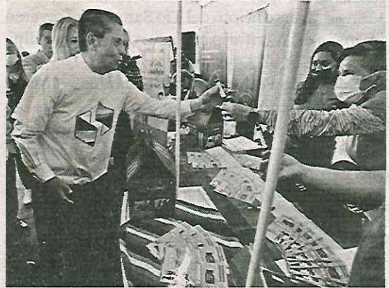
● El alcalde recorrió los stands

Esta colaboración entre la administración coyoacanense y la iniciativa privada tiene la finali-