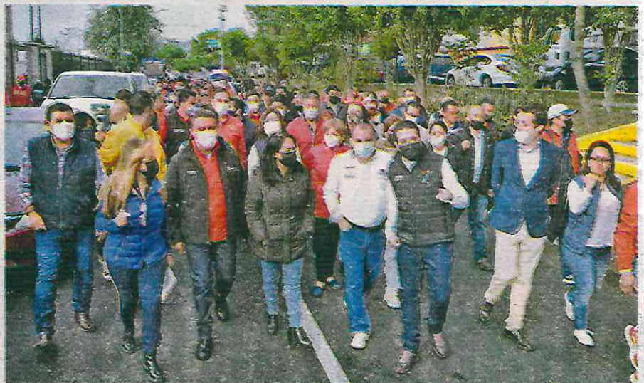
La alcaldesa Margarita Saldaña supervisa las obras entre Azcapotzalco y Tlalnepantla de Baz

“Cuando no se trabajan nuestras fronteras vamos haciendo que se conviertan en zonas olvidadas; me da mucho gusto que hoy tengamos la oportunidad de decir que con Tlalnepantla estamos trabajando y haciendo equipo; cada uno en el lado