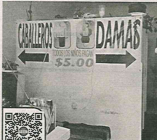
· Capta cada baño $75 mil al mes

Otro aspecto que resaltó el morenista durante una entrevista con Diario BASTA!, es el desvío realizado por Cuevas Nieves a través "de los autogenerados, como los (ingresos) de los sanita-