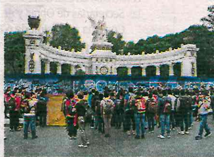
Acto político cultural, de los padres y normalistas de Ayotzinapa

El Gobierno capitalino reitera su compromiso por garantizar el derecho a la expresión y continúa llamando a manifestarse pacíficamente, sin afectar a terceras personas.