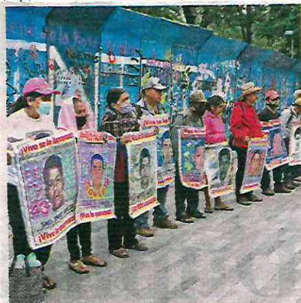
El mitin realizado por Madres y Padres de los 43 estudiantes desaparecidos transcurrió en calma y sin contratiempos en el Hemiciclo a Juárez