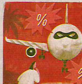
ILUSTRACIÓN: ANI CORTÉS