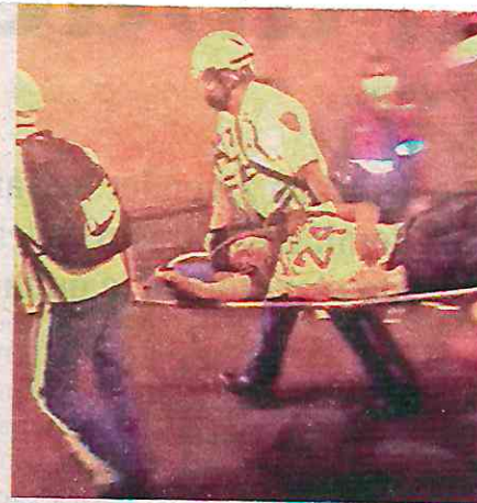
Según las autoridades, Grupo Firme superó la cifra de asistentes que había registrado Vicente Fernández

En una de las calles que conducen al Zócalo se registró una riña entre policías y asistentes al concierto. Además se reportaron una decena más de personas que fueron víctimas de desmayos.